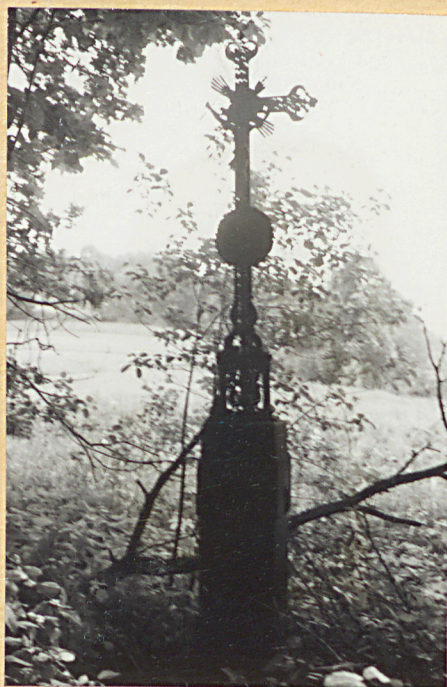
2. Nagrobek z krzyżem żel. z 1900 r.