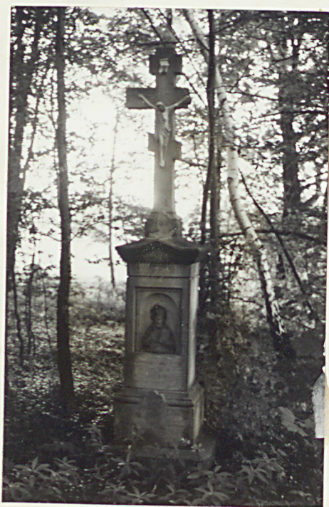
7. Krzyż kamienny Teodor Macko + 1904r.