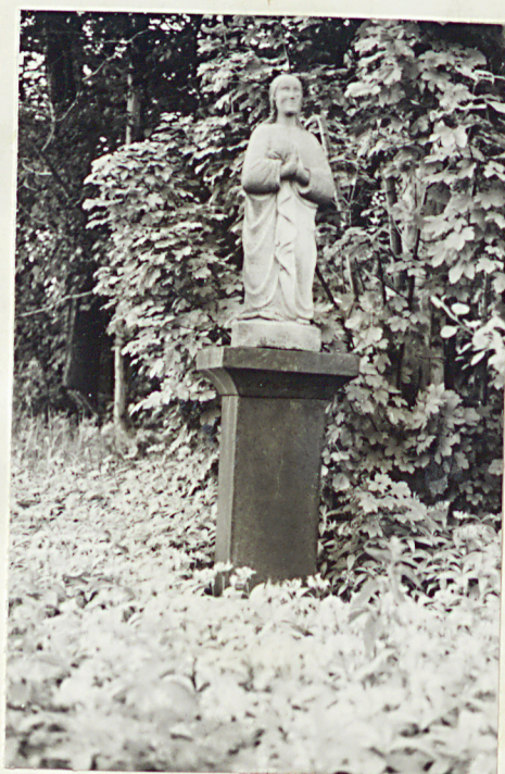
8. Figura kamienna k. XIX w.