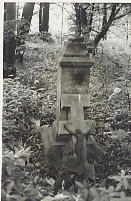
6. Nagrobek kamienny uszkodzony Leszko Wargan + 1904r.