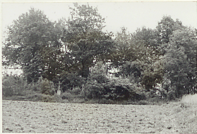
11. Widok od strony wsi