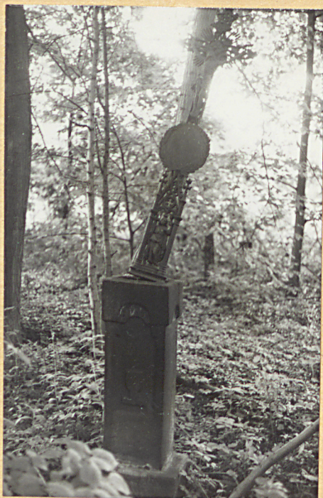
1. Nagrobek z krzyżem żel. z k.XIX w.