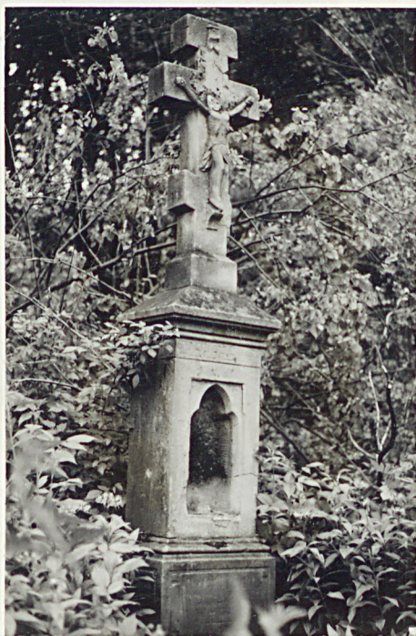
10. Krzyż kamienny Wasilij Kasznik + 1906r.