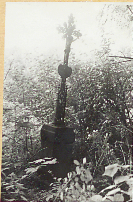
3. Nagrobek z krzyżem żel. z k.XIX w.