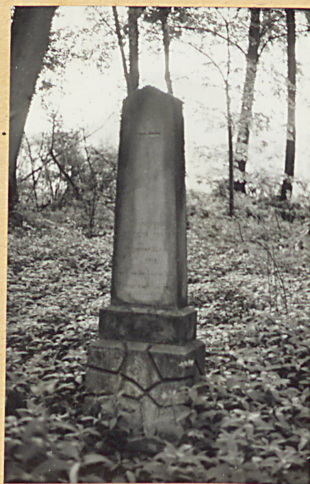
4. Obelisk - Zenobij Duma + 1892r.