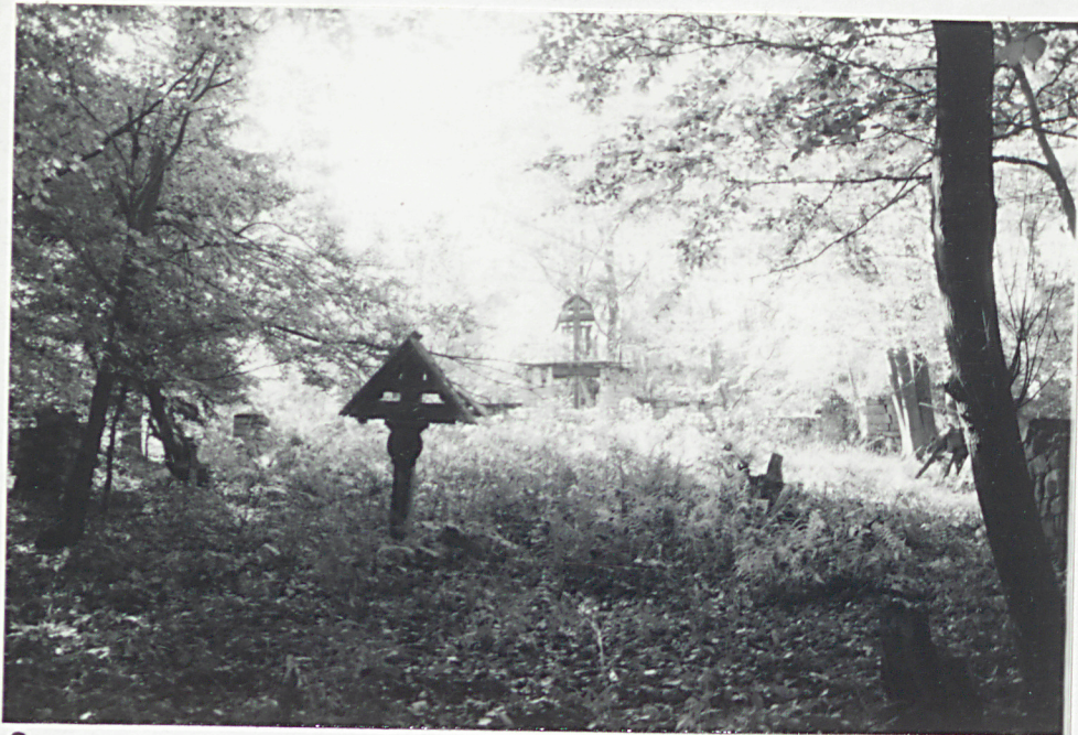
8. WNETRZE CHENTARZA