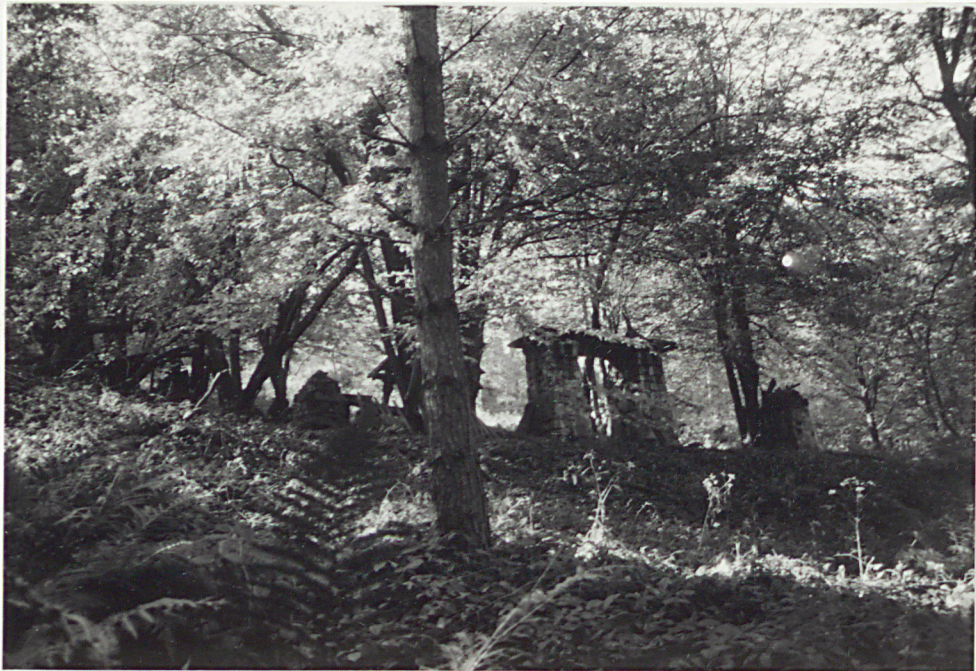
4. STRONA PÓŁDNIOWO-ZACHODNIA