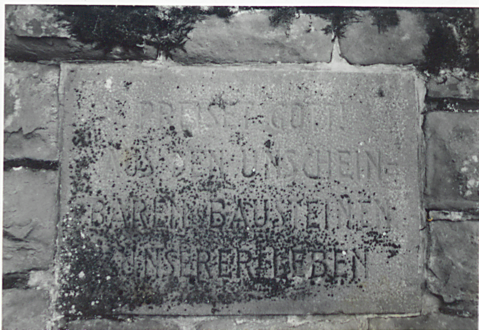
TABLICE PRZY OBELISKU