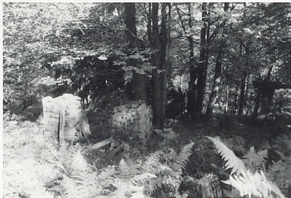
6. FRAGMENT MURU - STUPKI