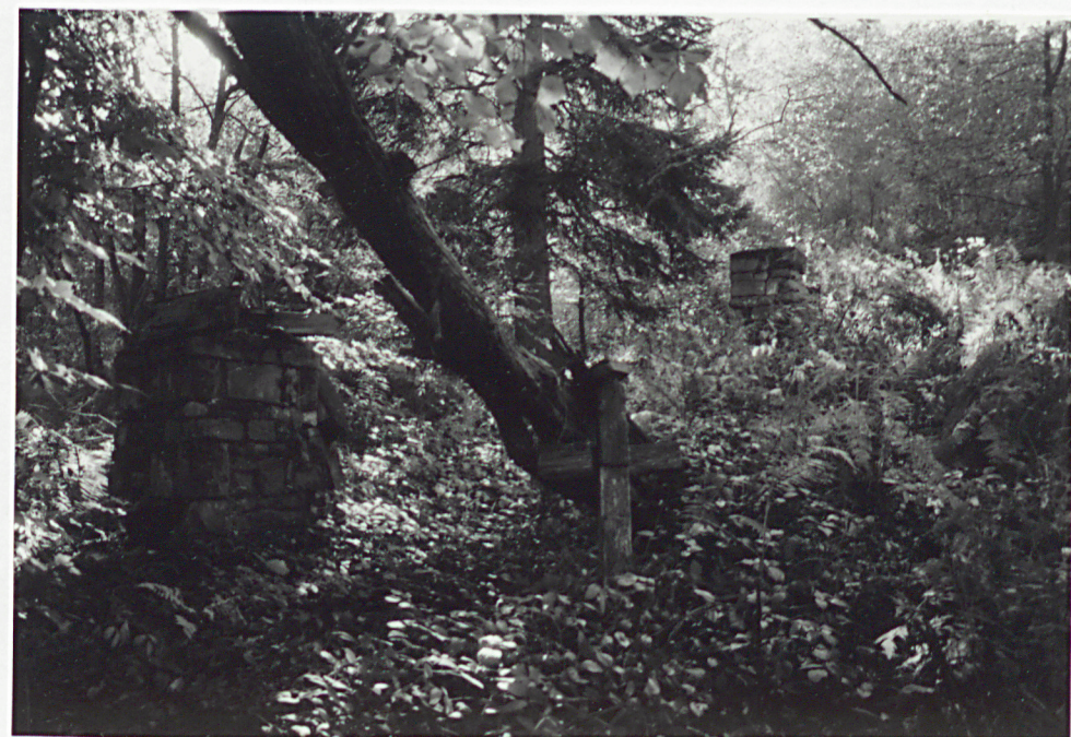
7. STRONA PÓŁNOCNO-WSCHODNIA