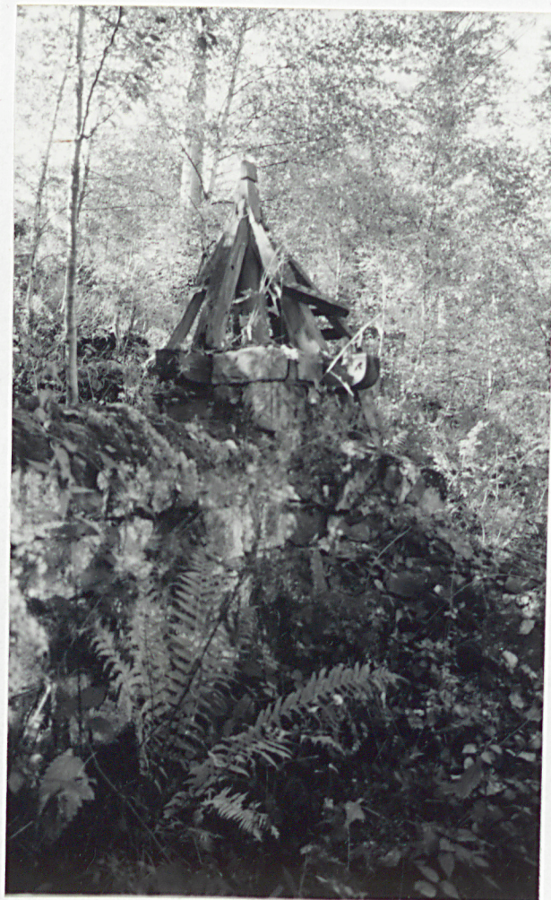
10. FRAGM. MURU W STRONIE PN. 11.