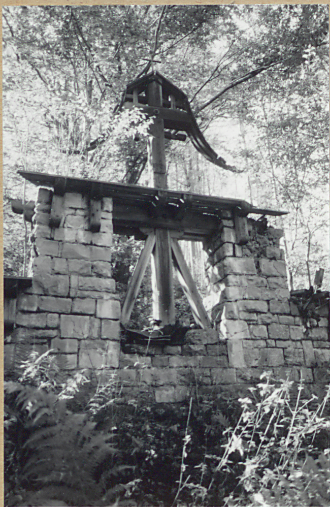
2. POMNIK - OBELISK