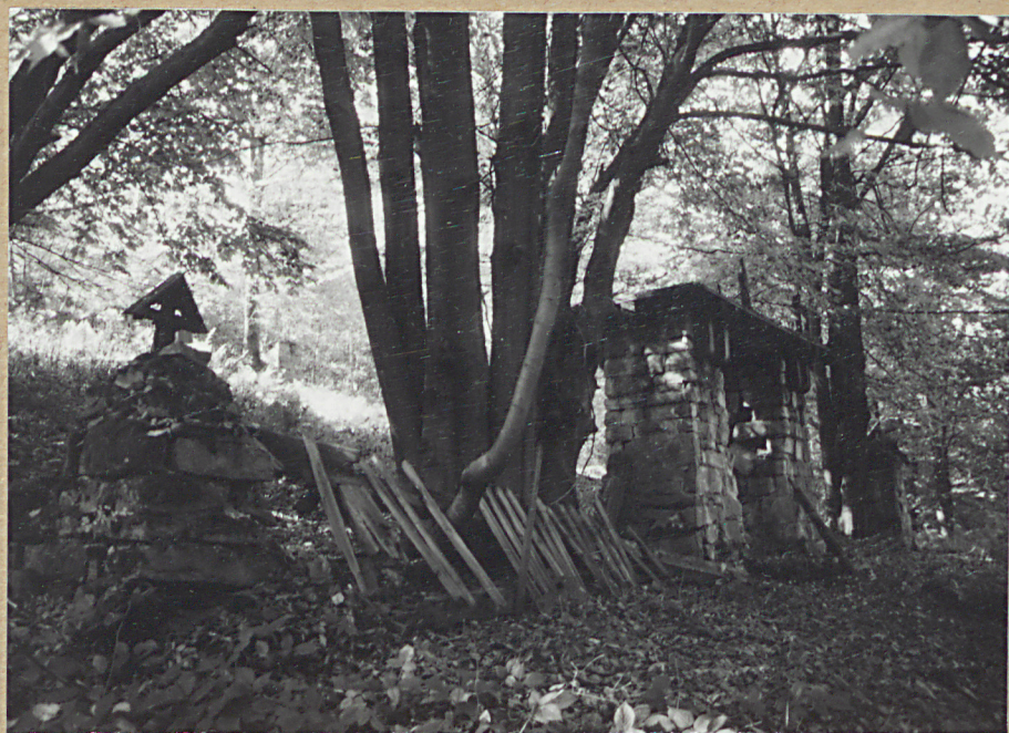
1. WIDOK Z ZEWNĄTRZ