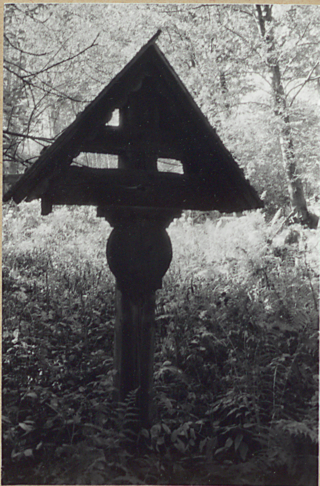
3. KRZYŻ DREWNIANY