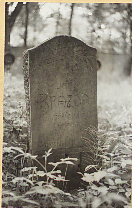
2. Nagrobek kamienny