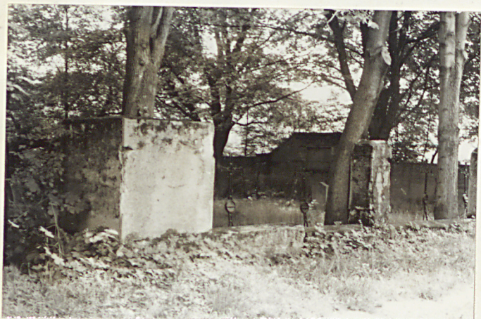
9. Widok ogólny