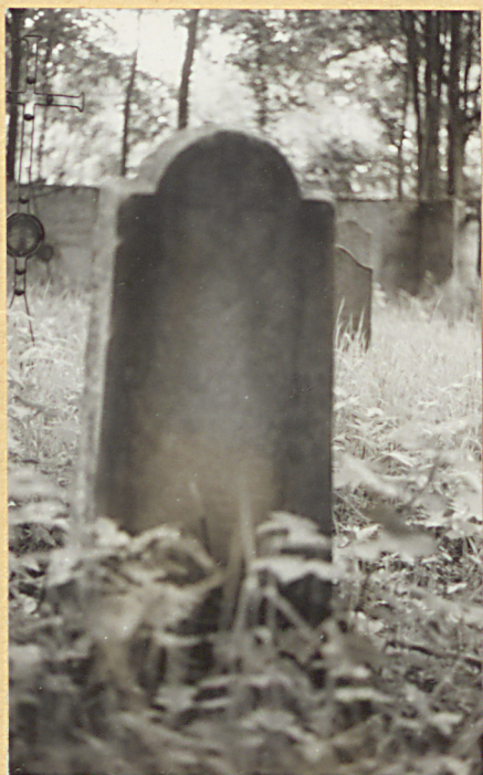
1. Nagrobek kamienny