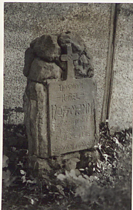
5. Nagrobek kamienny