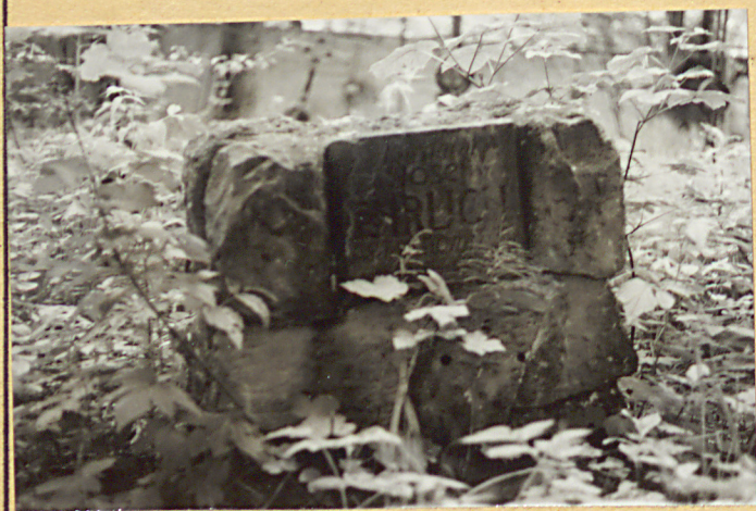
3. Nagrobek kamienny