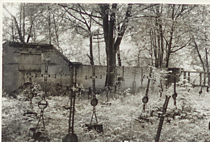
8. Widok ogólny