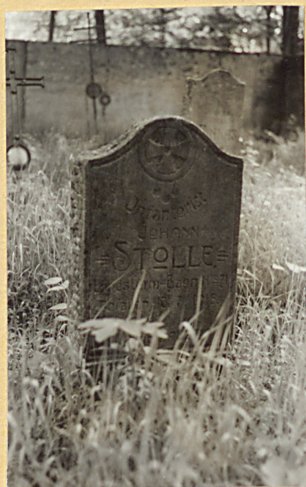
4. Nagrobek kamienny