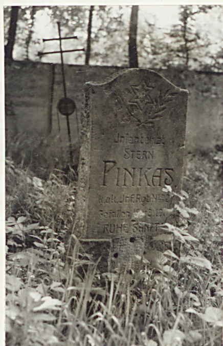
6. Nagrobek kamienny