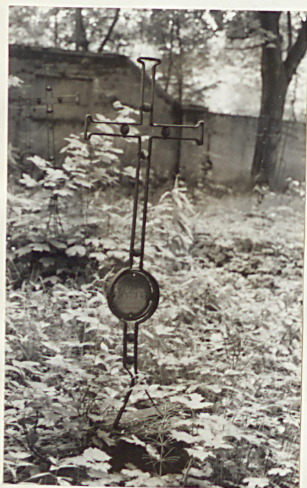
7. Krzyż żel.