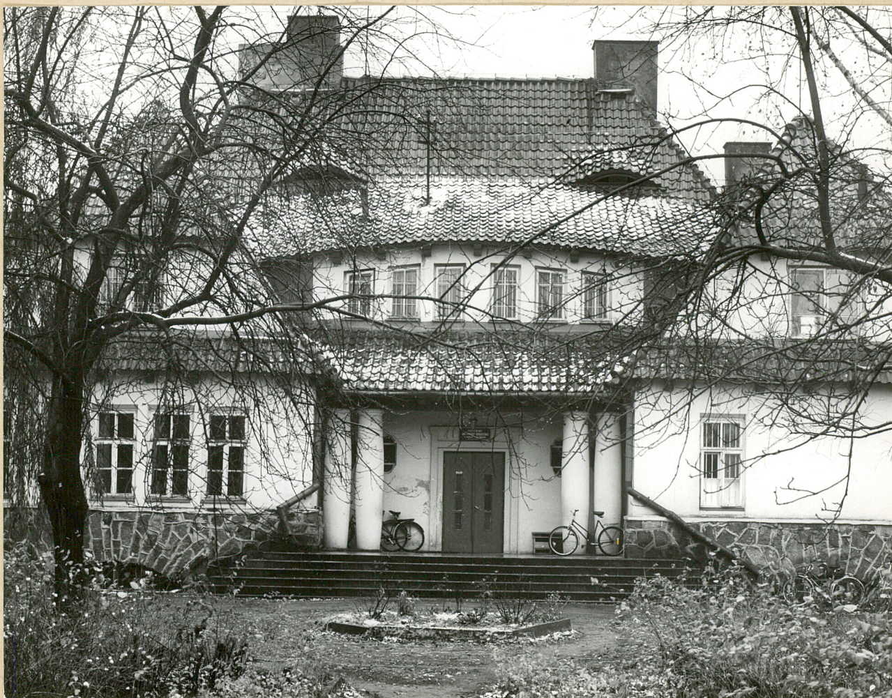
Fot. 1. Dąbrowa-Leszczyny. Elewacja frontowa dworu. 11.1981 r