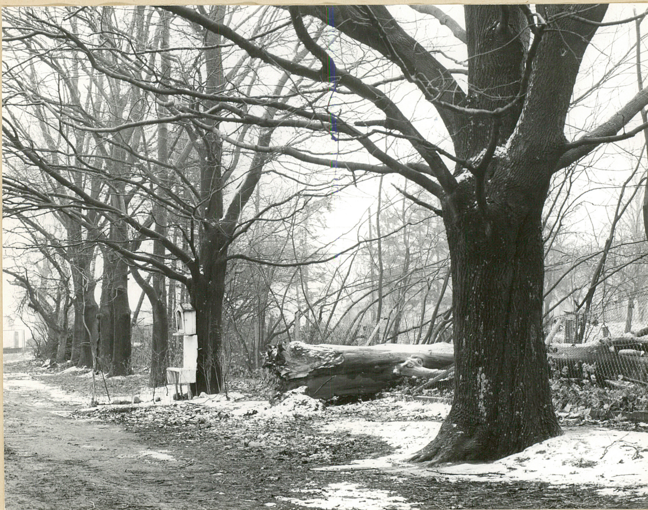
Fot. 6. Dąbrowa-Leszczyń. Fragment drogi wjazdowej fot. W. Maliński 11.1981 r.