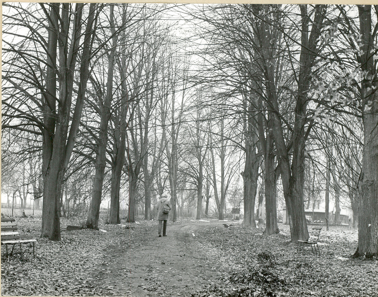
Fot. 3. Dąbrowa-Leszczyny. Fragment alei lipowej wiodącej do bramy wjazdowej.