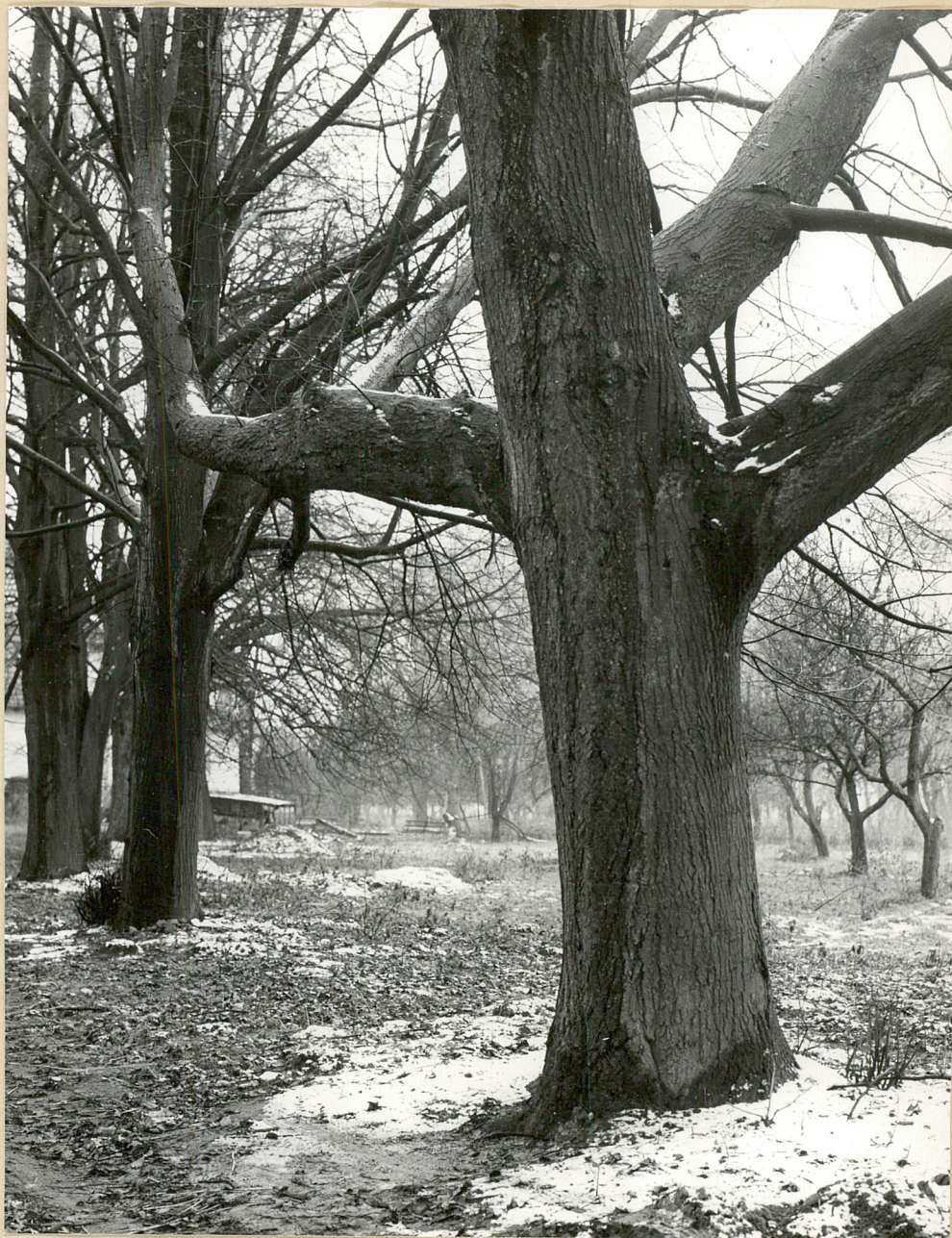
Fot. 5. Dąbrowa-Leszczyny. Stare lipy w alei 11.1981 r.