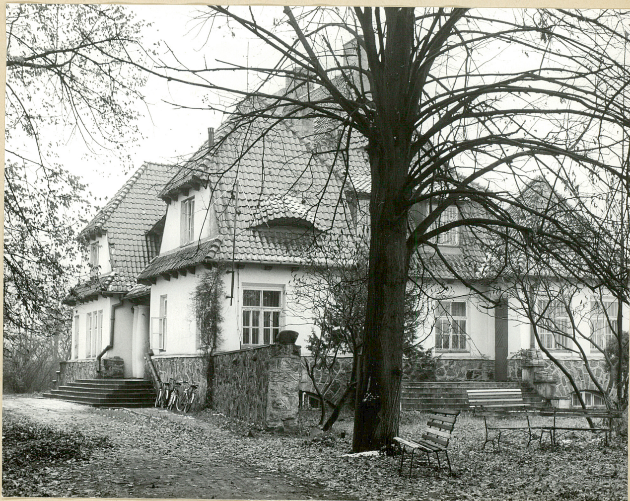
Fot. 2. Dąbrowa- L eszczyny. Widok na dwór ze strony południowo- zachodniej.