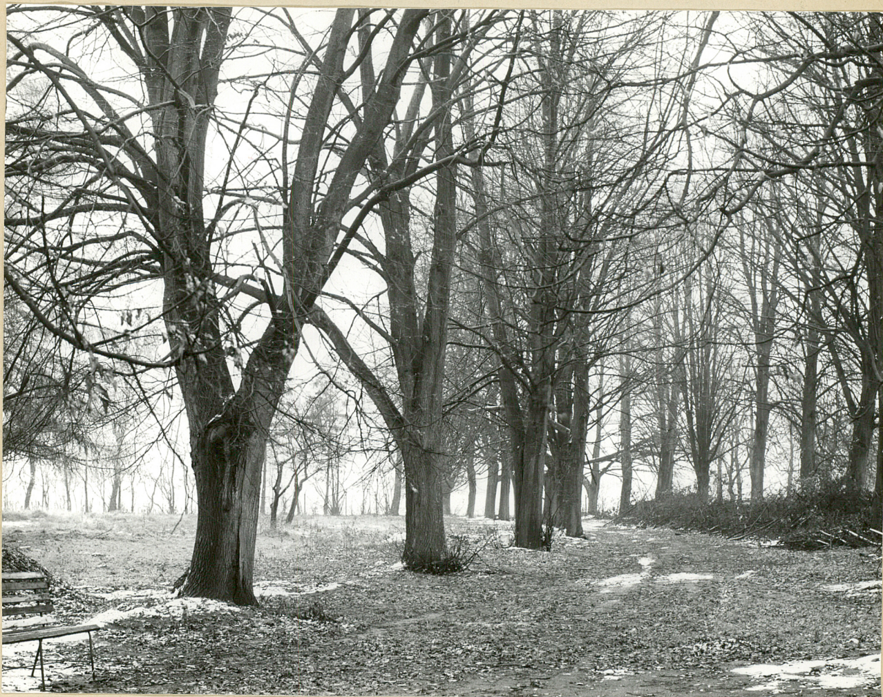
Fot. 4. Dąbrowa-Leszczyny. Drugi fragment alei kończy się na północnym krańcu parku