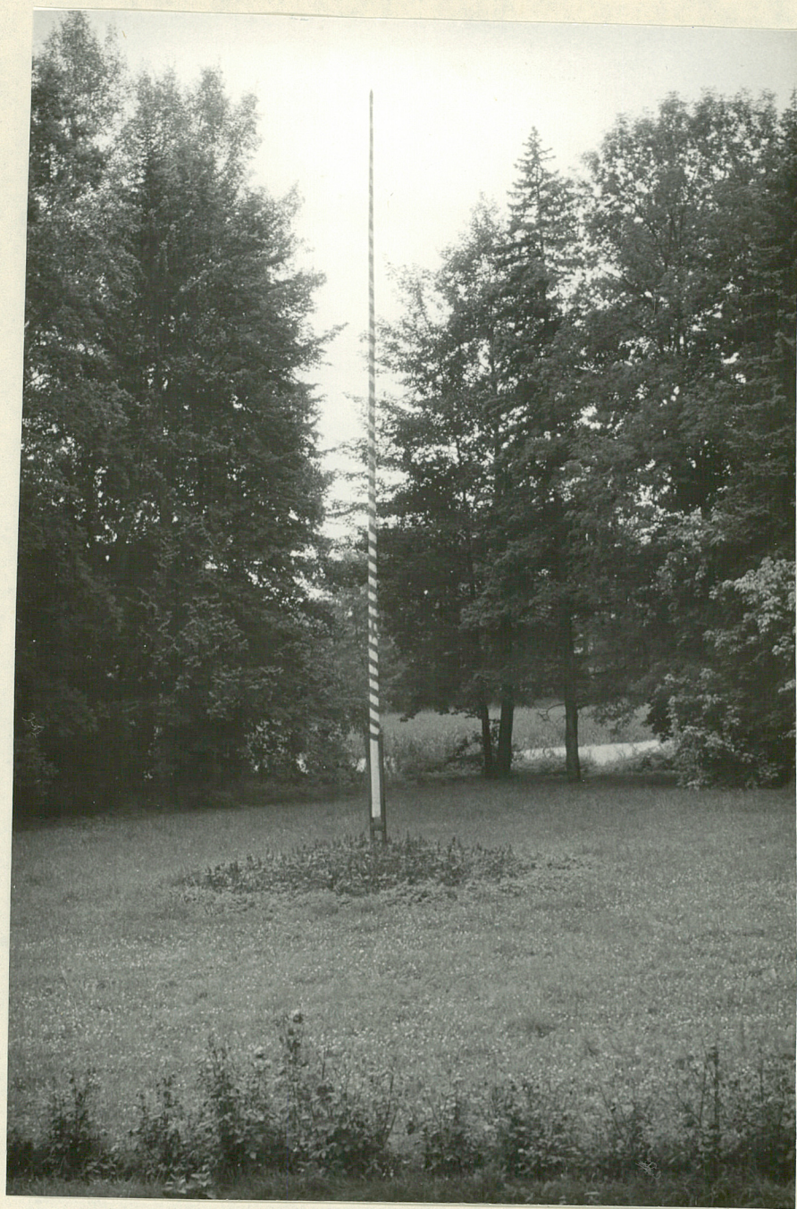
Fot.4. Psary. Oś widokowa z dworu. 1977.