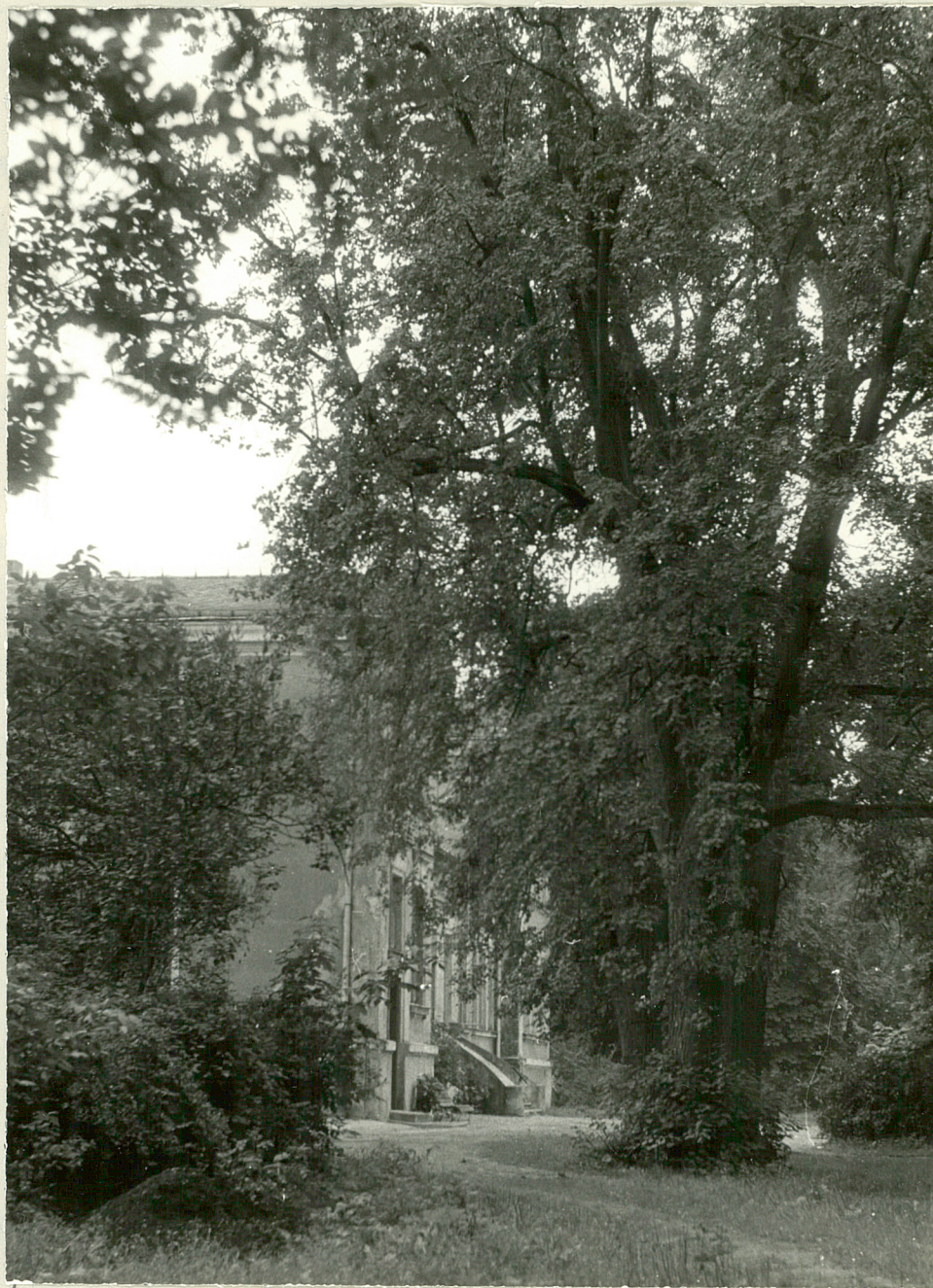
Fot. 3. Psary. Stara lipa. 1977.