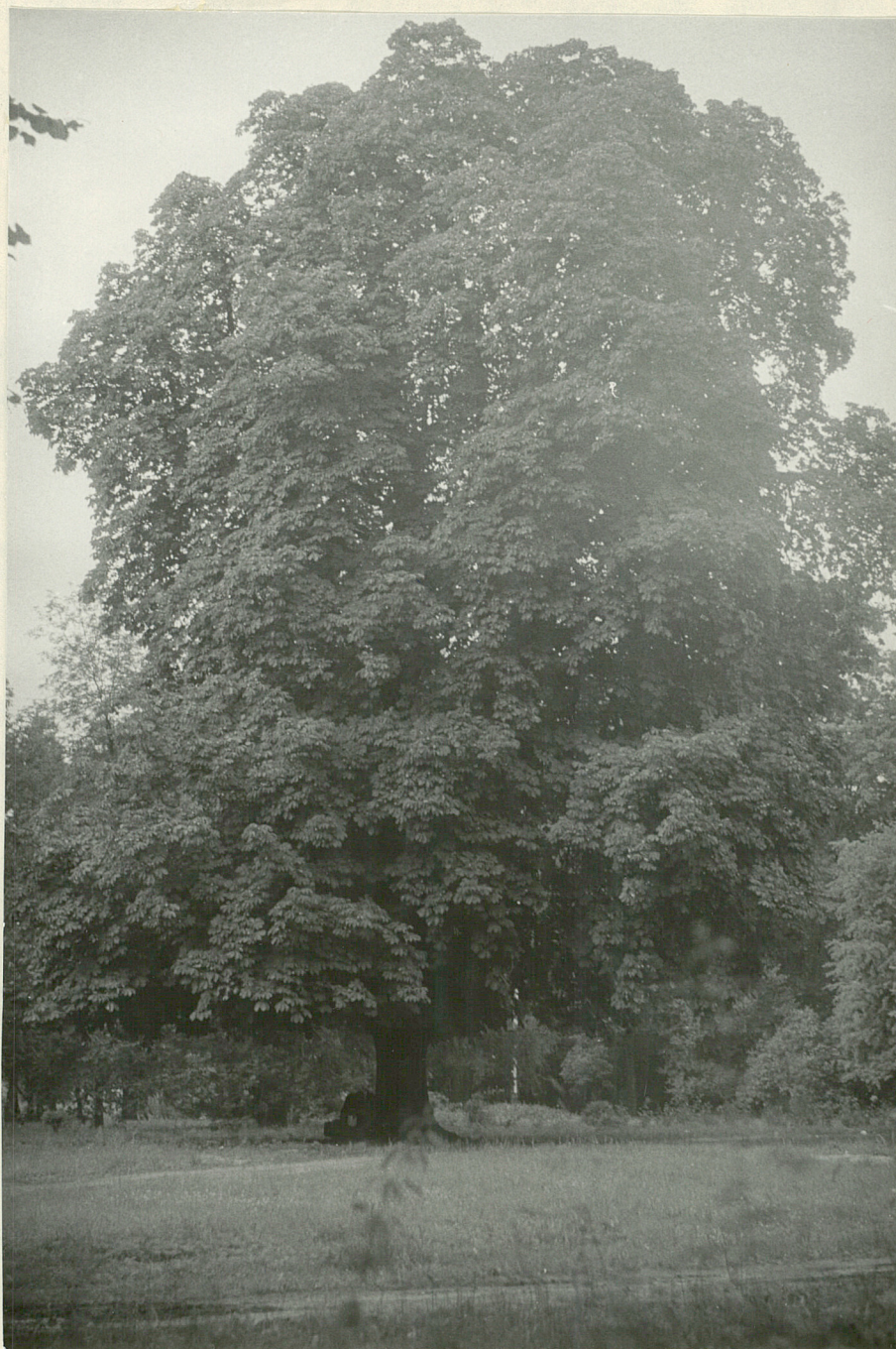
Fot. 5. Psary, Kasztanowiec. 1977.