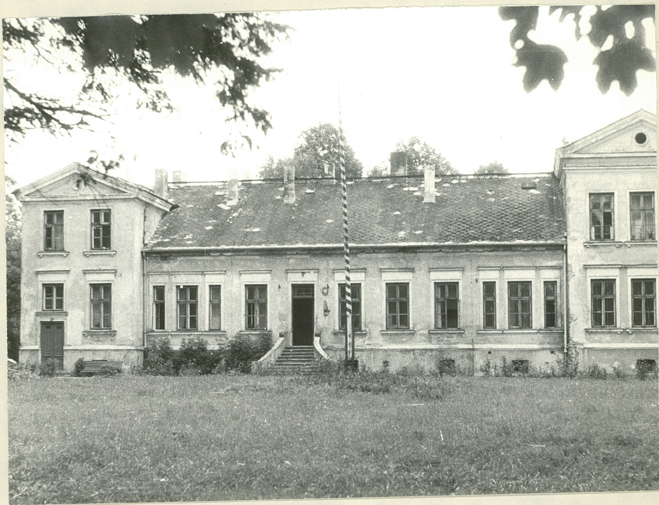
Fot.1. Psary. Dwór, elewacja zachodnia. 1977.