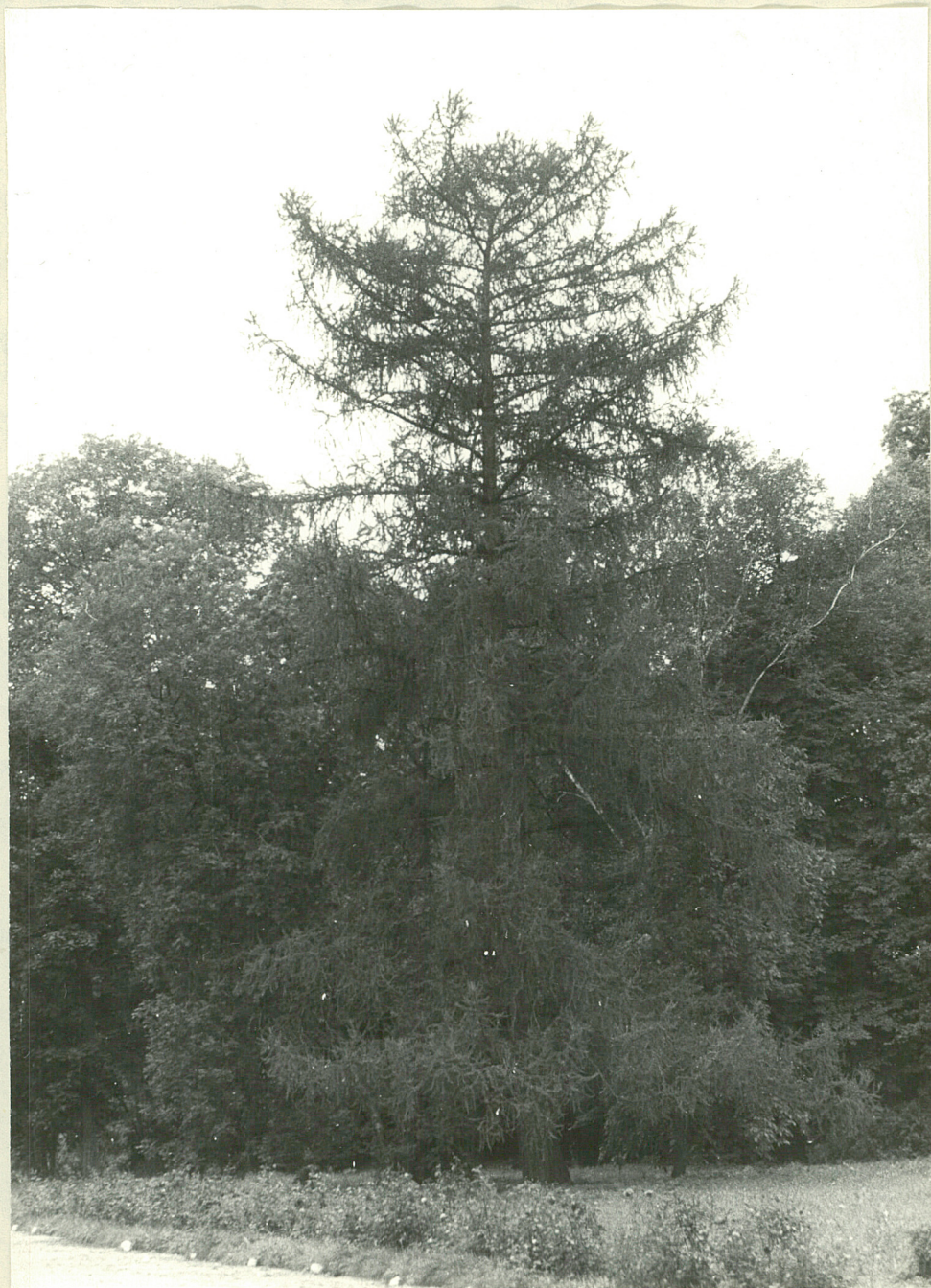
Fot.2. Psary. Część parku przed dworem. 1977.