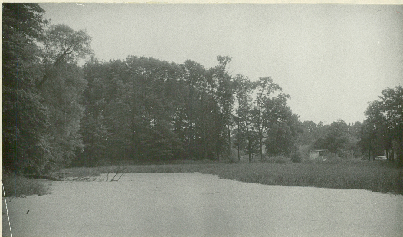
Fot.6. Psary. Staw "Świtez". 1977.