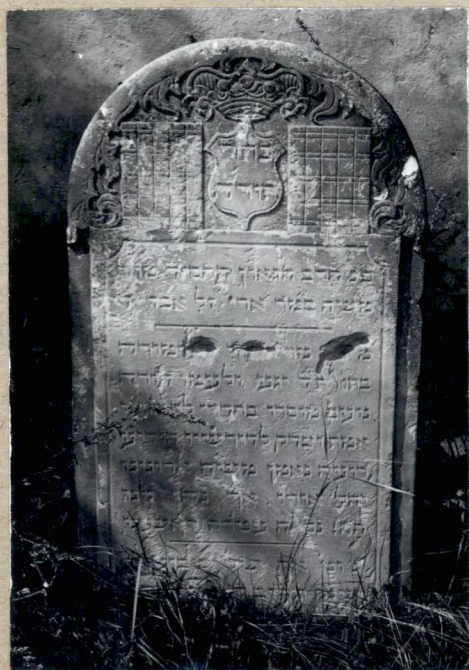
6 Nagrobek miski