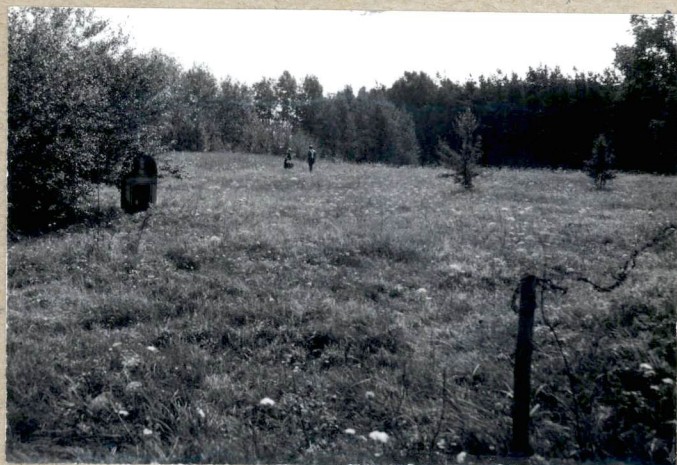
4 Teven cumentarza - Po lewej stronie nagrobek.