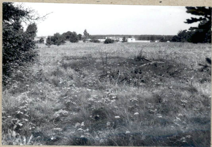
2 Teven cumentarza. W okolicy budynku wysypiska śmieci.