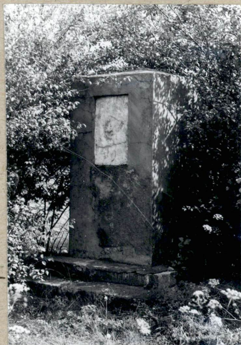
5 Fragment nagrobka.