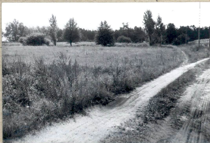
3 Długa cumentarna.