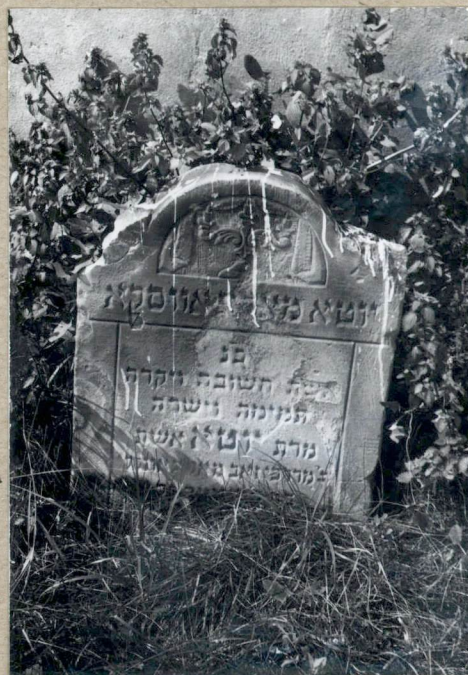
7 Nagrobek kobiety obok budynku.