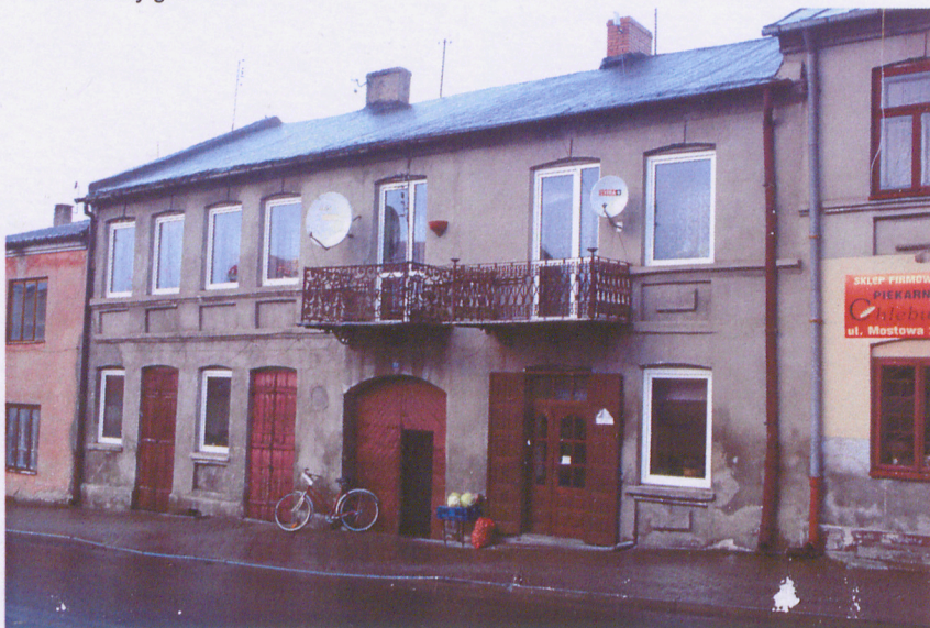
Przedbórz, ul. Mostowa 23. Widok od południa