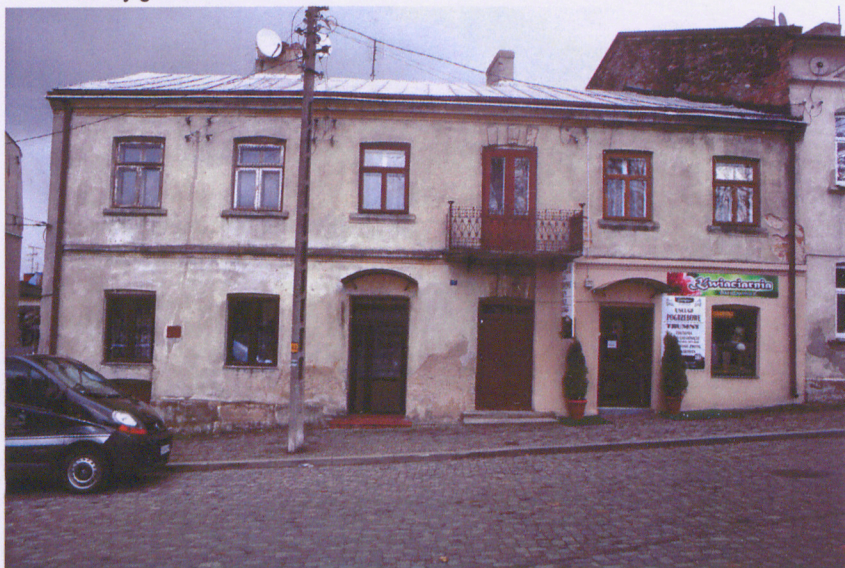
Przedbórz, ul. Kielecka 5. Widok od południa