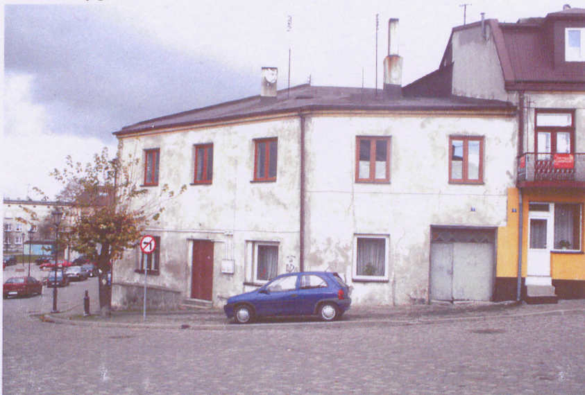
Przedbórz, ul. Kielecka 1. Widok od południa