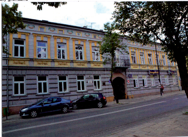
Tomaszów Maz., ul. Mościckiego 12 – dom Widok od północnego-wschodu