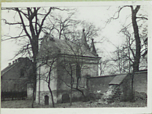
Kaplica z 1 poł. XIX w. bezstylowa. Murowana, na planie prostokąta.