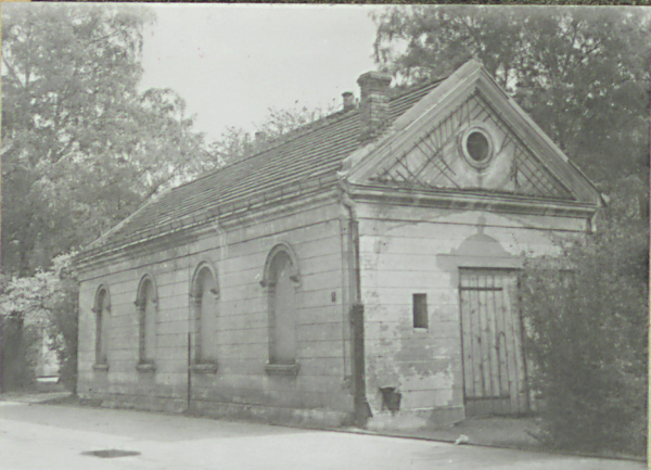
gi opisowe, fotografia