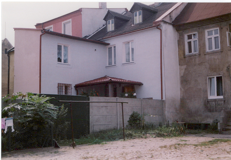
elewacja podwórzowa, wsch.