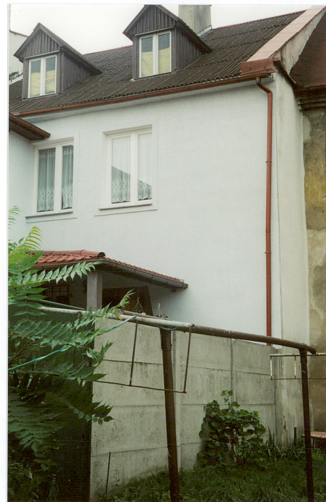
elewacja podwórzowa, wsch.