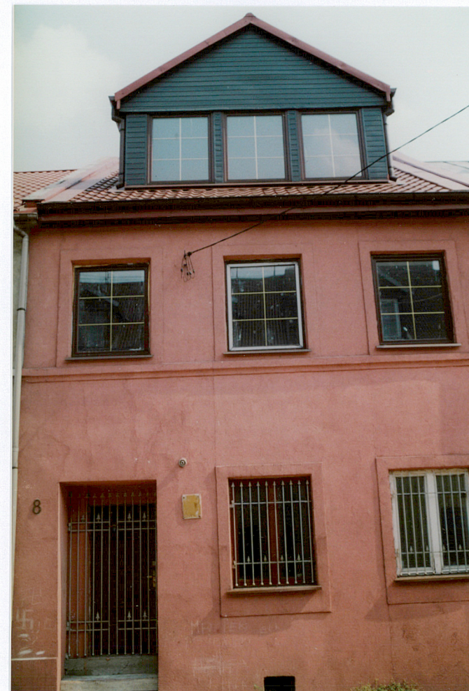
elewacja frontowa, zach.