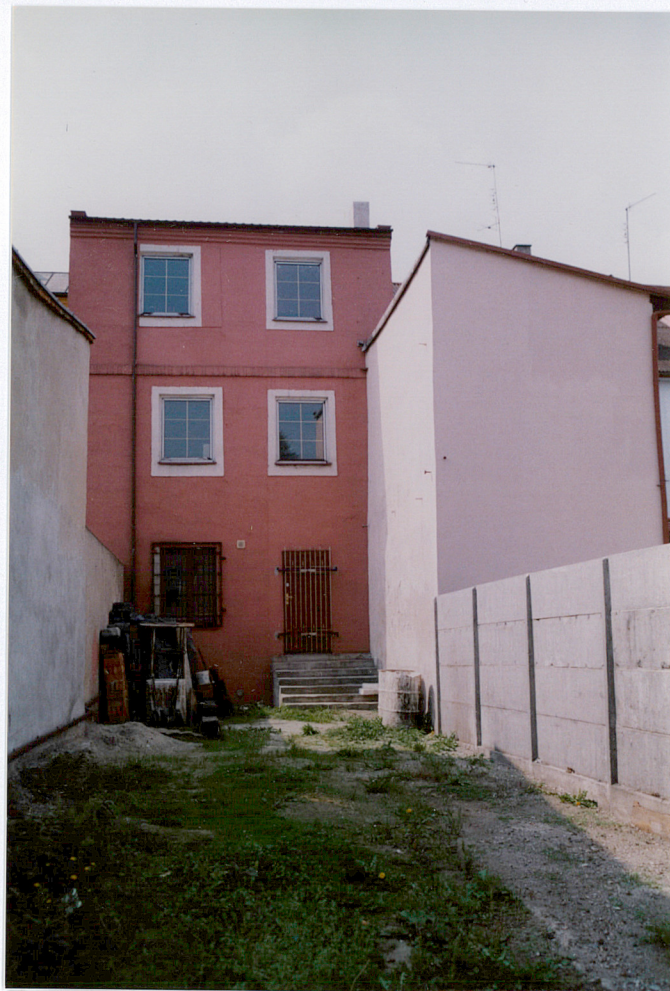
elewacja podwórzowa, wsch.

5. Zawartość wkładki (nazwa materiału uzupełniającego) Zdjęcia