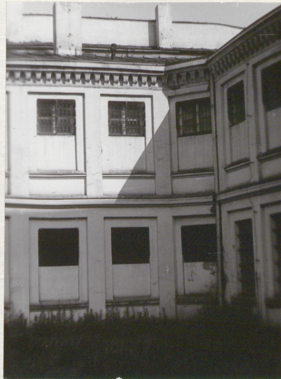
wkładkę założył: J. Warszawa, wrzesień 1983r.