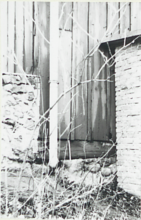
2. Poradzenie dzwonnicy od p.m. 2 pr. str. dost. Ubiórka.