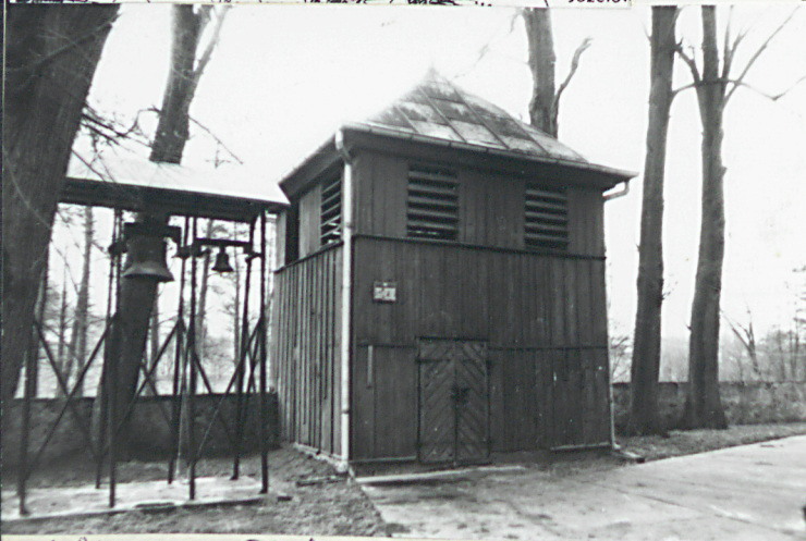
1. Elewacja poł. frontowa.