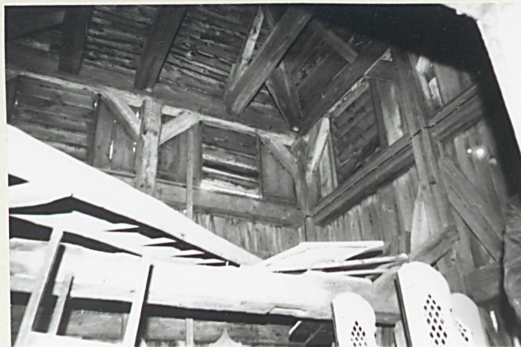
3. Otwory okienne, fragment masy dachowej.