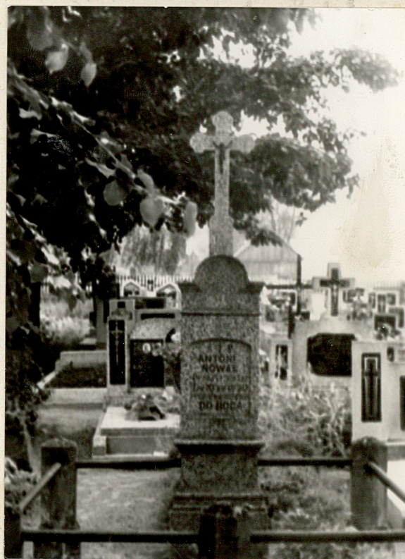
Zol. nr. 2 Nagrobek z 1930r. Antoni Nowak