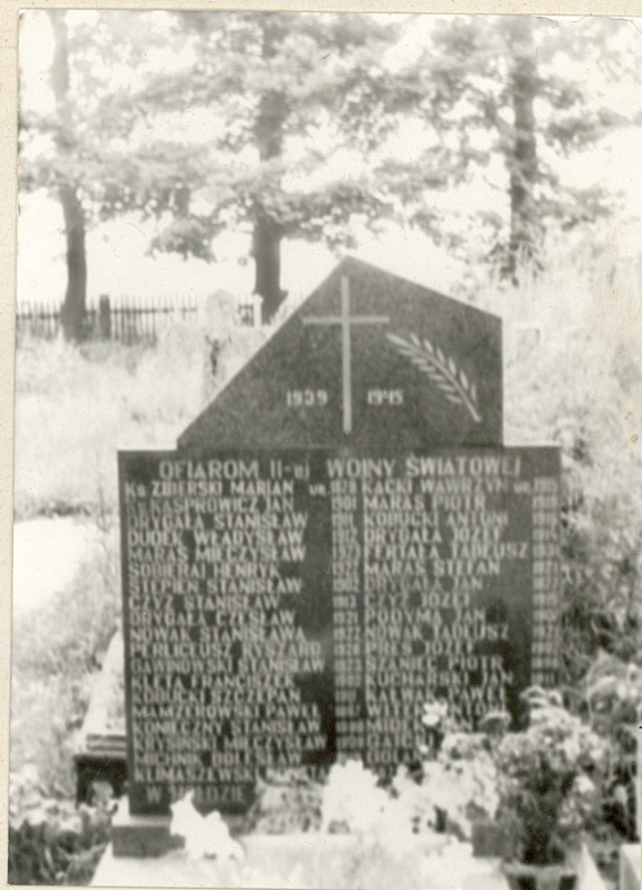
Zol. nr. 5 MPN