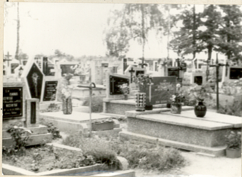
Zol. nr. 3 Fragment cmentarza