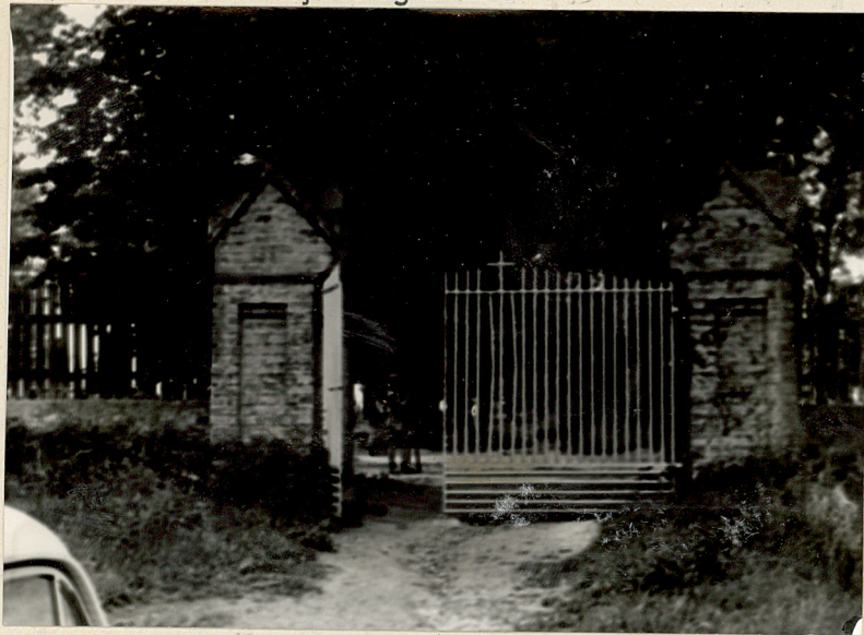
Zol. nr. 1 Widok ogólny cmentarza