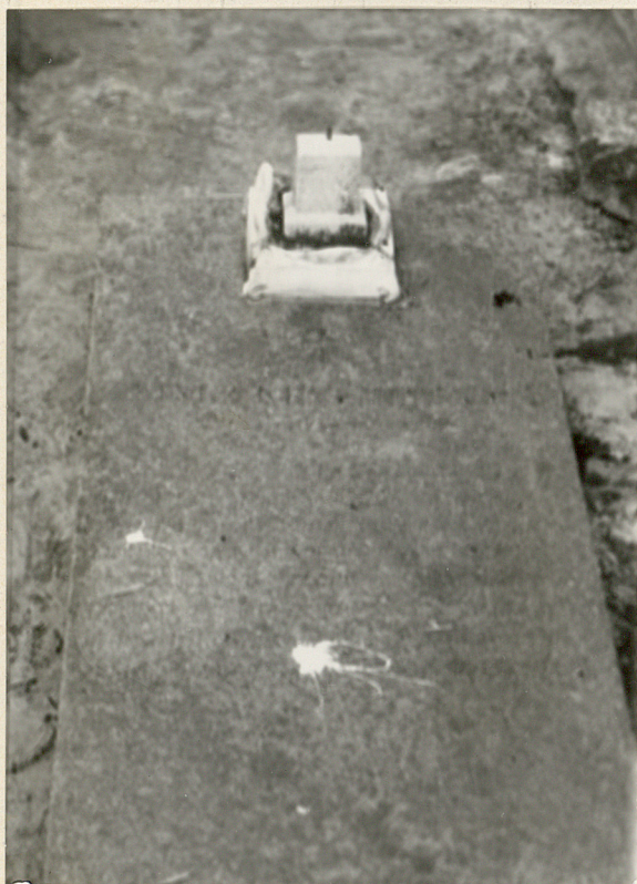
Zol. nr. 4 Najstarszy nagrobek