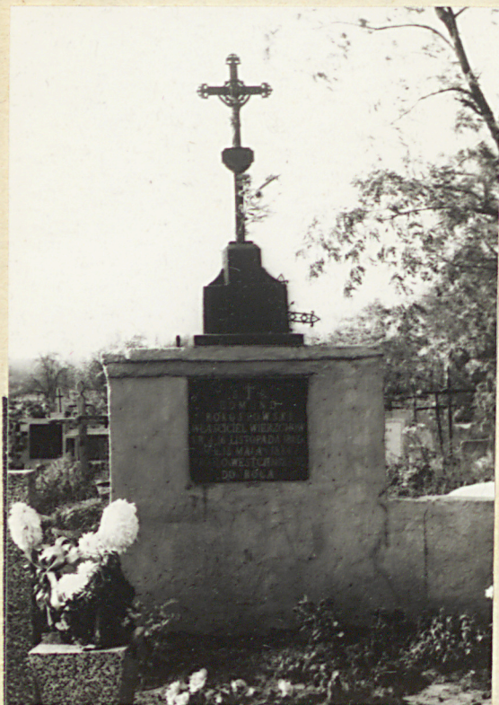
Zd. nr 3 Grobowiec nTasiciela Hierzchów - 1886v