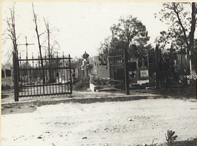
Zd. nr. 1 Brama cmentarza