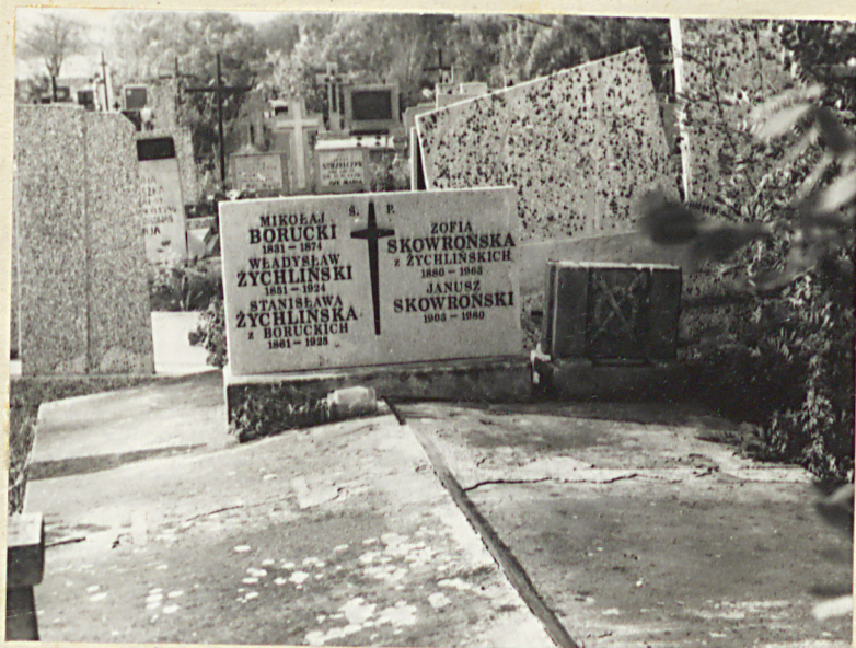
Zd. nr 4 Najstarszy nagrobek