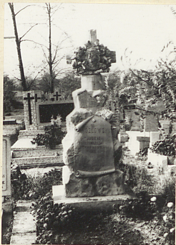
Zd. nr 2 Nagrobek ks. Antoniego Kozłowskiego z 1908v