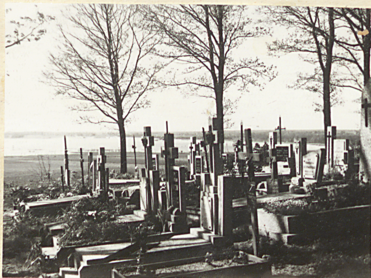
Zol. nr 2 Fragment cmentarza