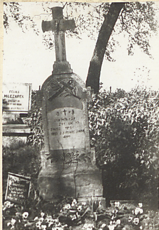
Zol. nr 3 Ciotkowski Piotr - nagrobek z 1945r.