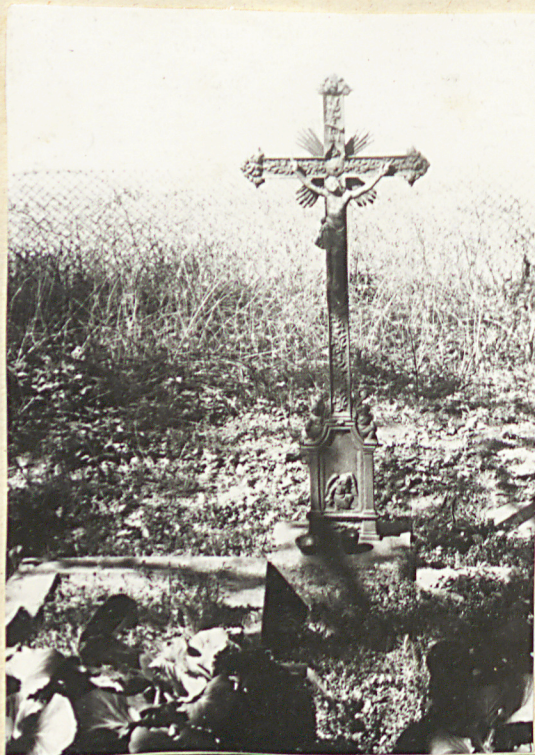
Zol. nr 6 Krzyż metalowy