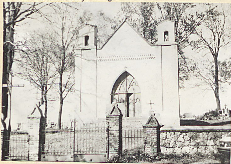
Zol. nr 1 Wzrost ogólny cmentarza z kapliczką