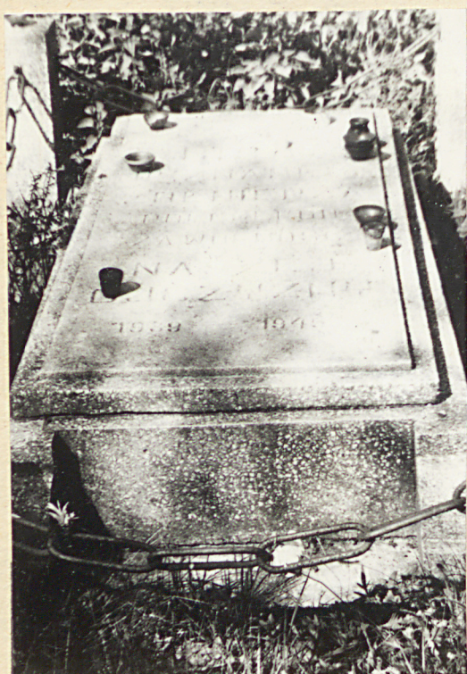
Zol. nr 5 MPN