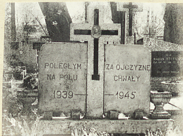
Zd. nr 6 MPN