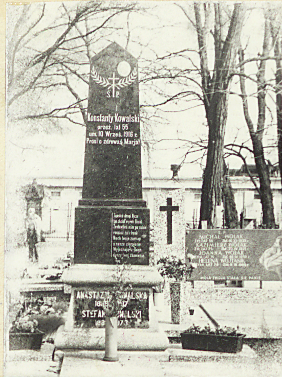
Zd. nr 2 Obelisk - Konstanty Kowalski 1916r.