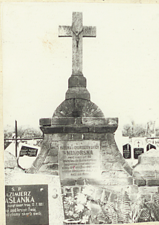
Zd. nr 4 Grobowiec z 1902r.