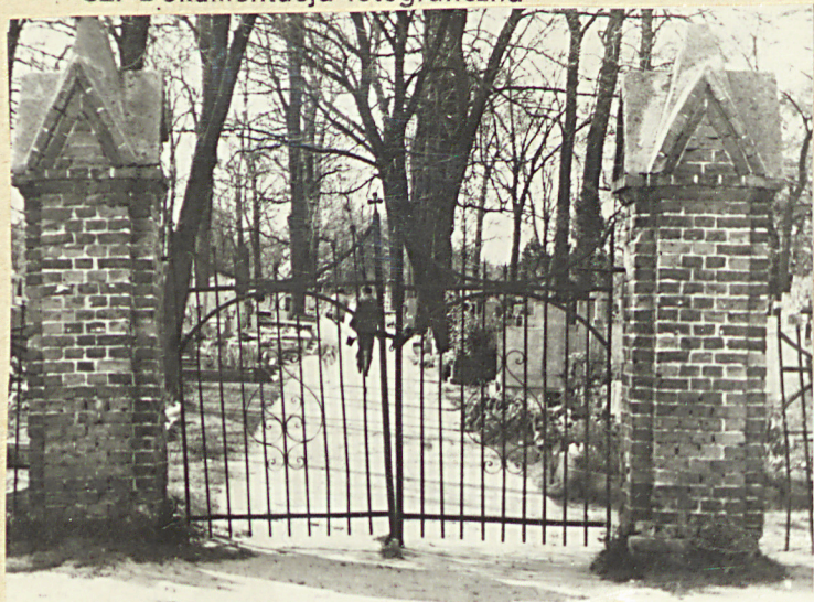
Zd. nr 1 Widok ogólny cmentarza