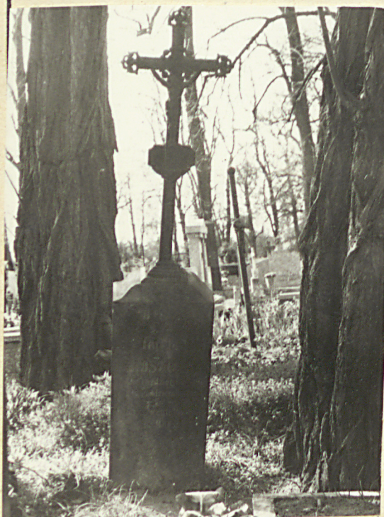
Zd. nr 5 Najstarszy nagrobek - 1894r