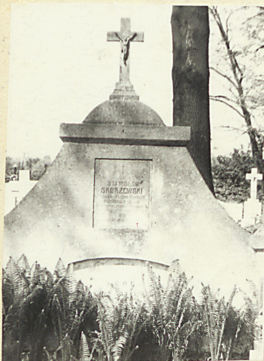
Zd. nr 3 St. Skórzewski - wł. majgłku Kloniszew - 1915r