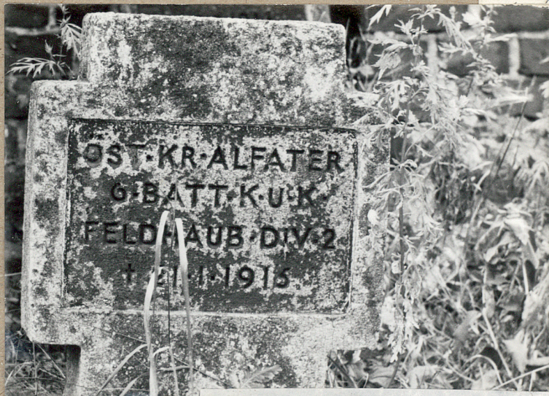
Kwatera wojenna z 1915 r.