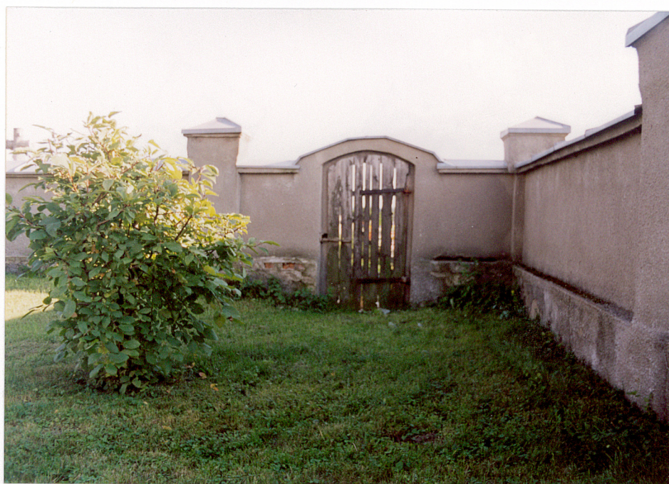
Łańcut w. 1 Grabów