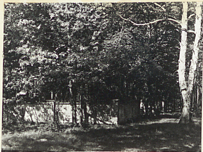
1. Widok ogólny na cmentarz