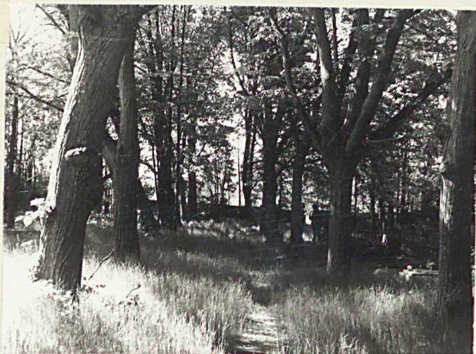
2. Część centralna cmentarza