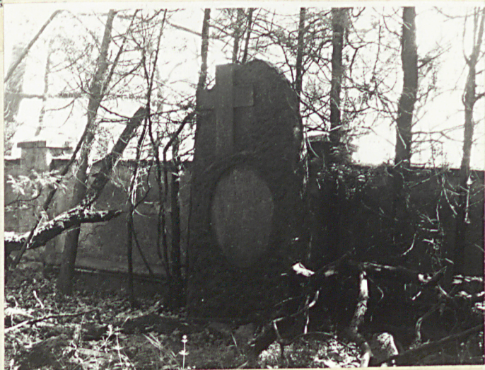
4. Nagrobek ewangelicki