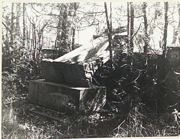
3. Nagrobki ewangelickie