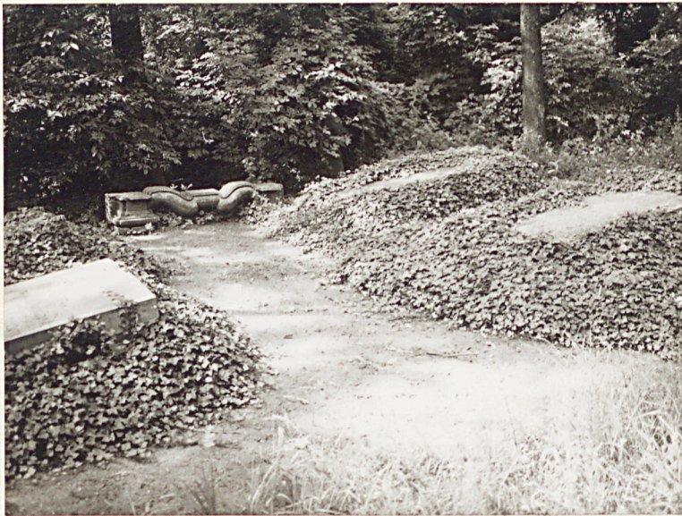
1. Widok ogólny na rozmieszczenie mogił rodziny v. Schmettow związanej z Pomorskiem