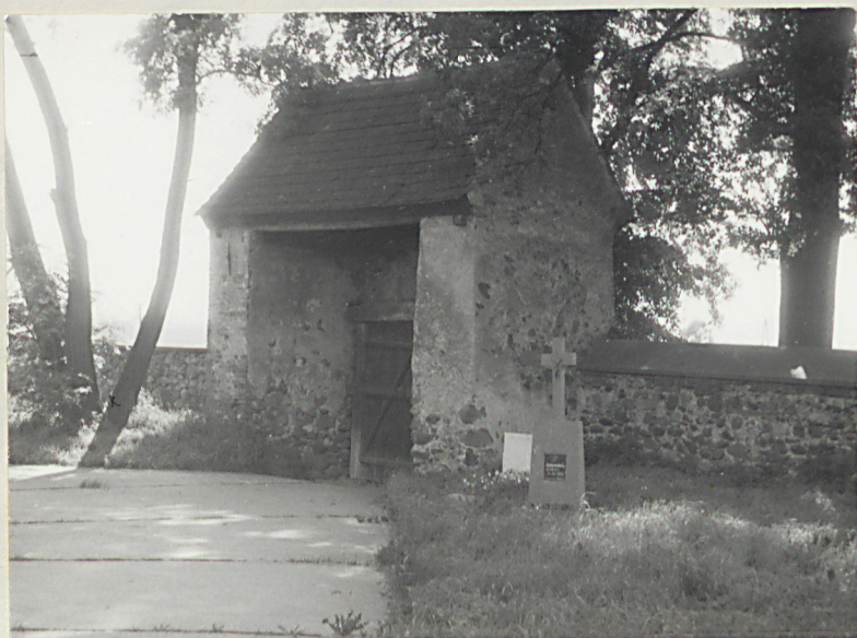
6. Budynek bramny