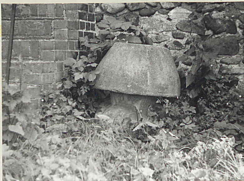
5. Kamień w kształcie grzyba