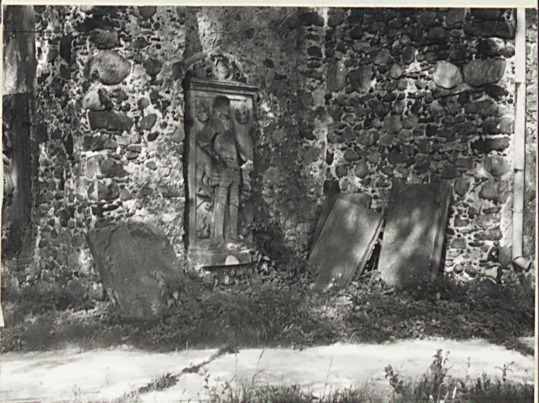
4. Płyty nagrobne