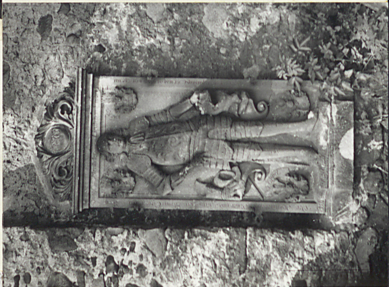
2. Płyta nagrobna