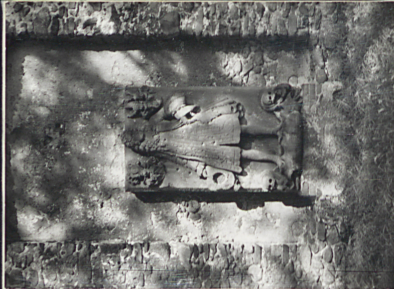
1. Płyta nagrobna