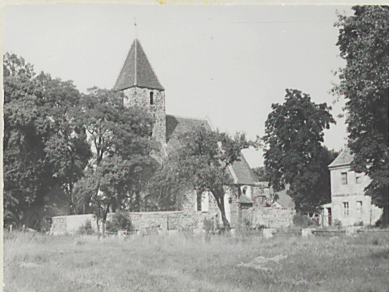
7. Widok ogólny