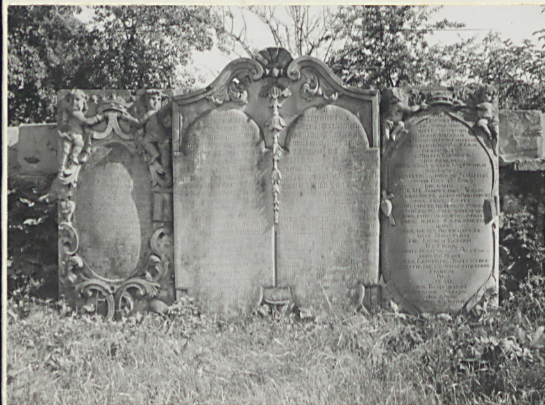
3. Płyta nagrobna