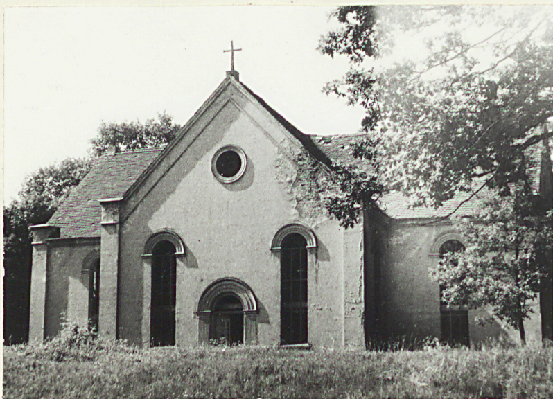
2. Widok ogólny