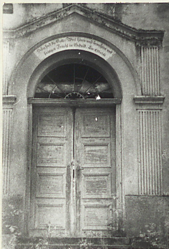
3. Wejście do zboru