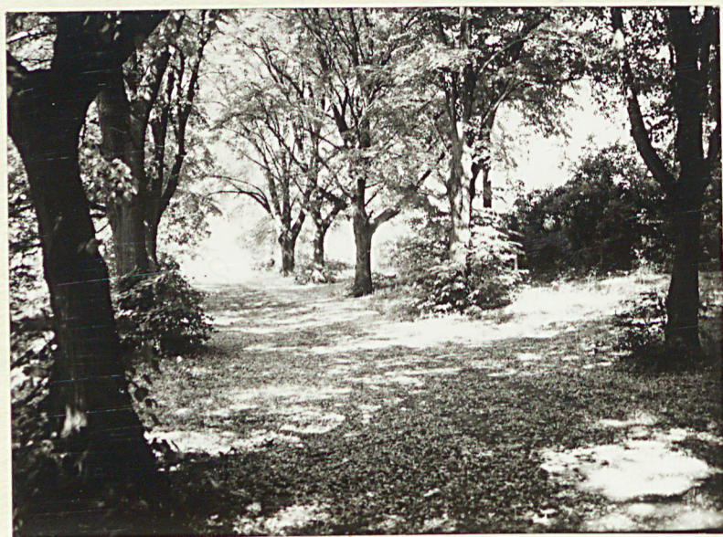
2. Widok ogólny głównej alei lipowo-klonowej