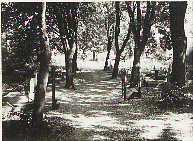
1. Widok ogólny na teren cmentarza w kierunku nowych kwater grobów rzymsko-katolickich