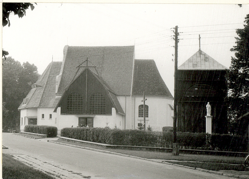
4. Widok ogólny