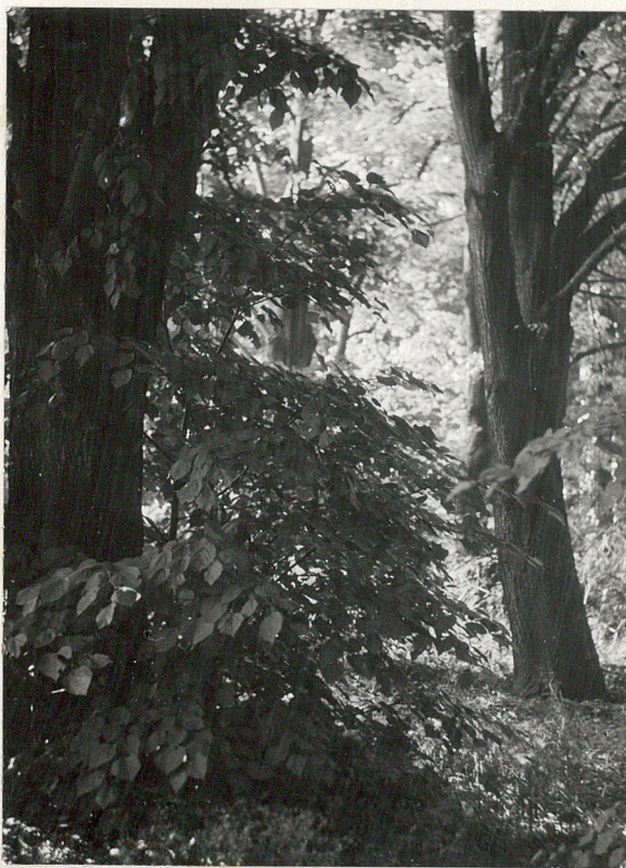
2. Aleja lipowa