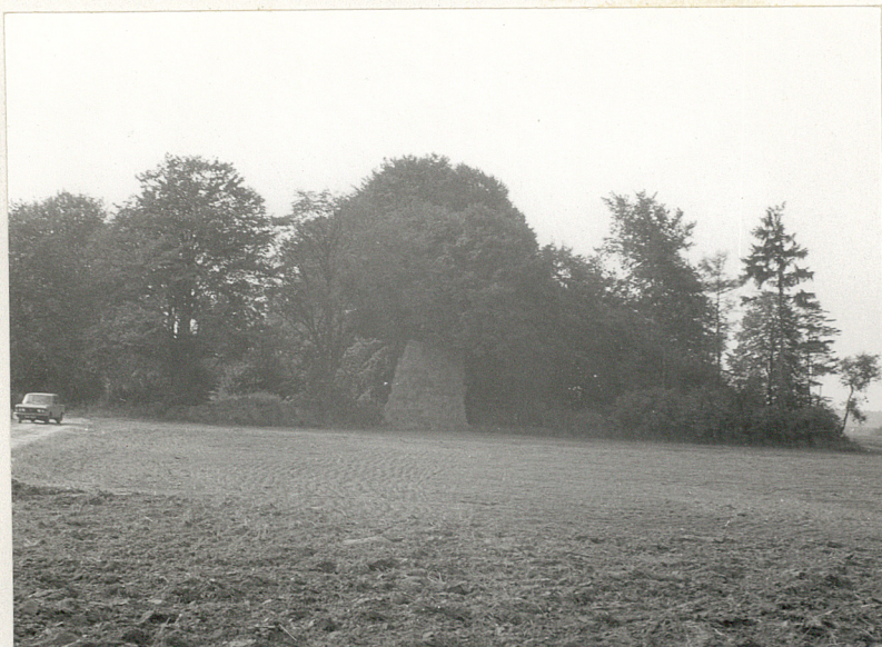
1. Widok ogólny