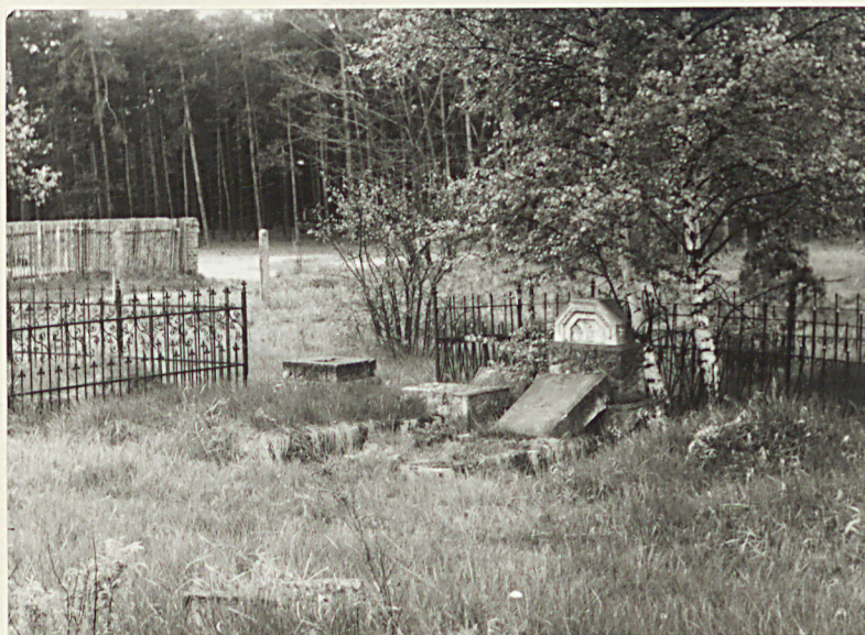
1. Krotki i nagrobki awangardistyczne