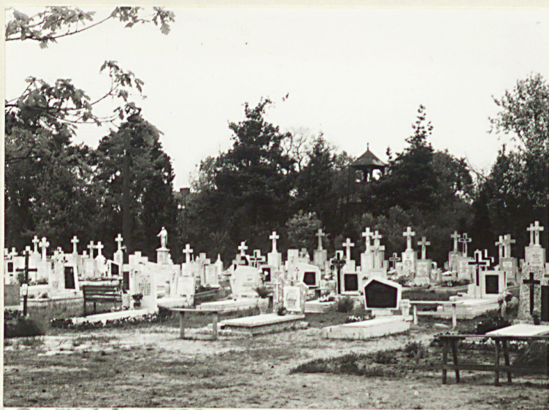
2. Widok ogólny