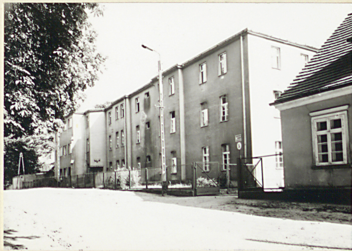
7. DANY DOK ZARONNY