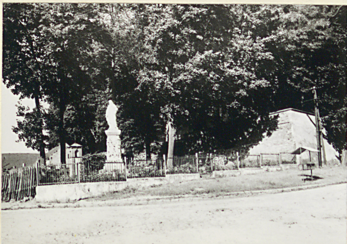
6. FIGURA I MUZ