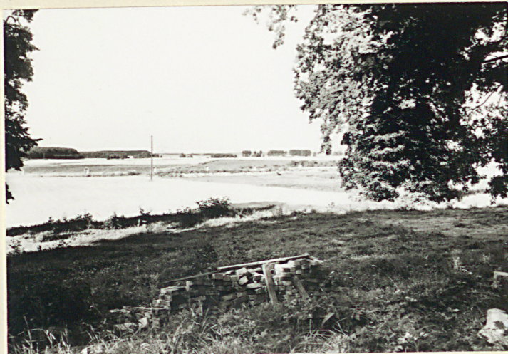
5. CMENTARZ W BUDOWIE