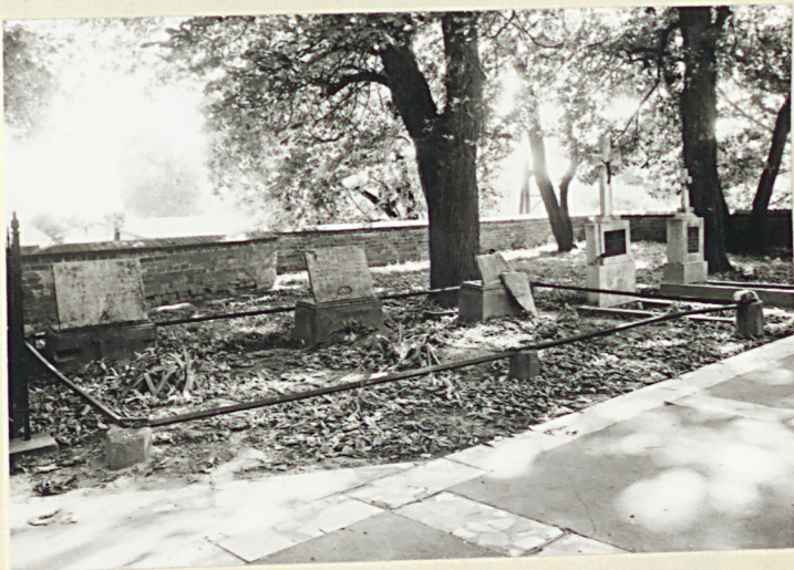
3. KWIATKA DZIEKANÓW