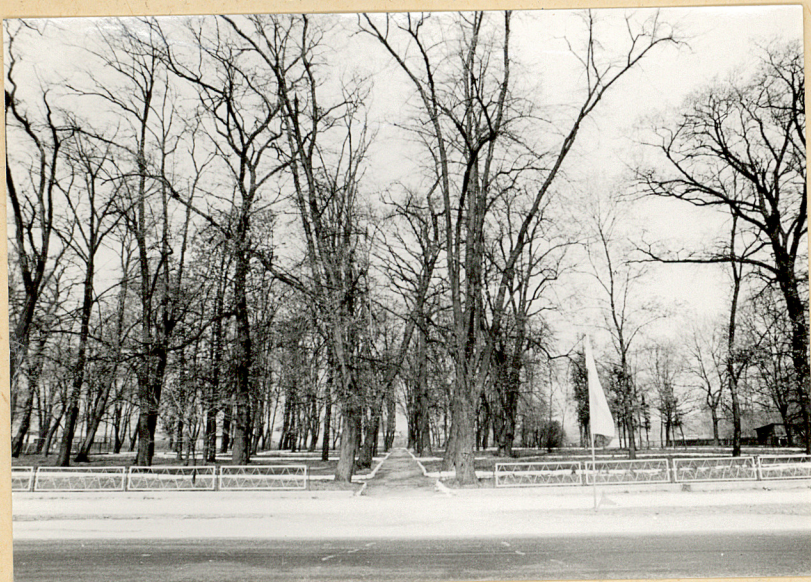
Przytoczna; park pocmentarny 1. Widok ogólny i aleja główna