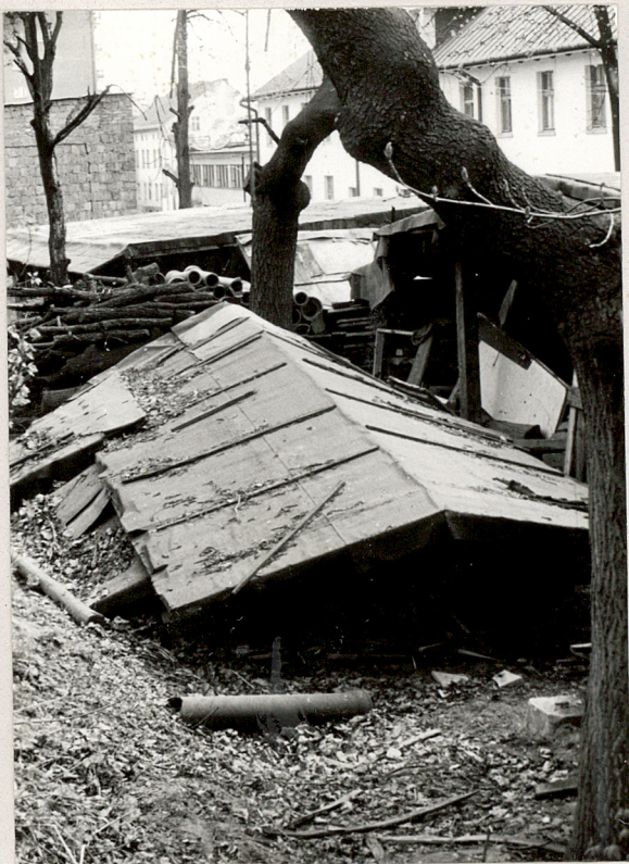
Gorzów Wlkp. ul. Okólna; cm. nieczynny 1. Widok ogólny 2-3. Wnętrze