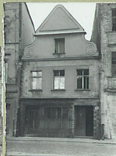
Zjednoczenie - sam. 1858, 18. 11. 57 - 12000 - kari.