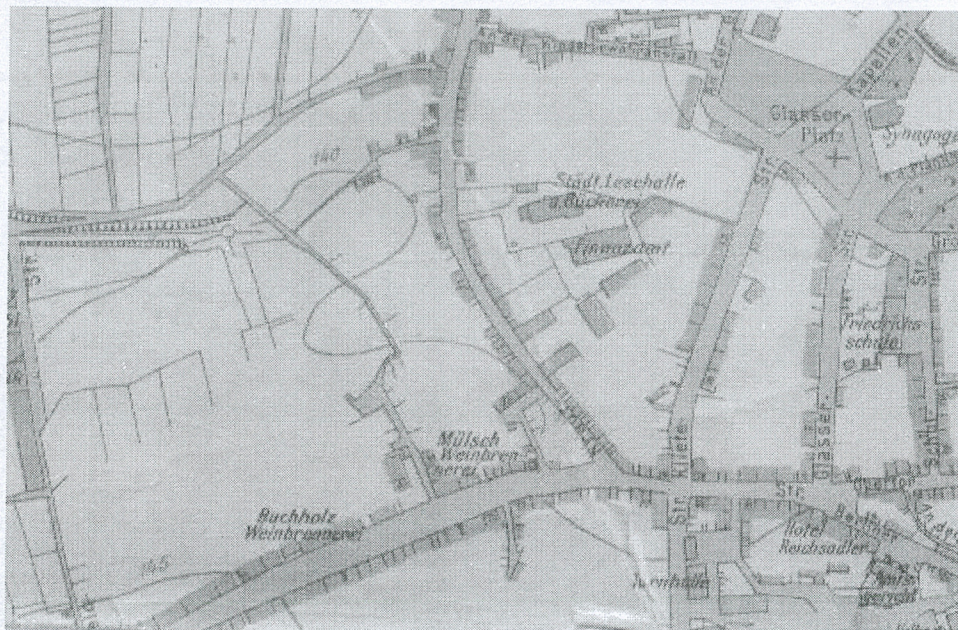
Fragment planu Zielonej Góry z 1926 roku