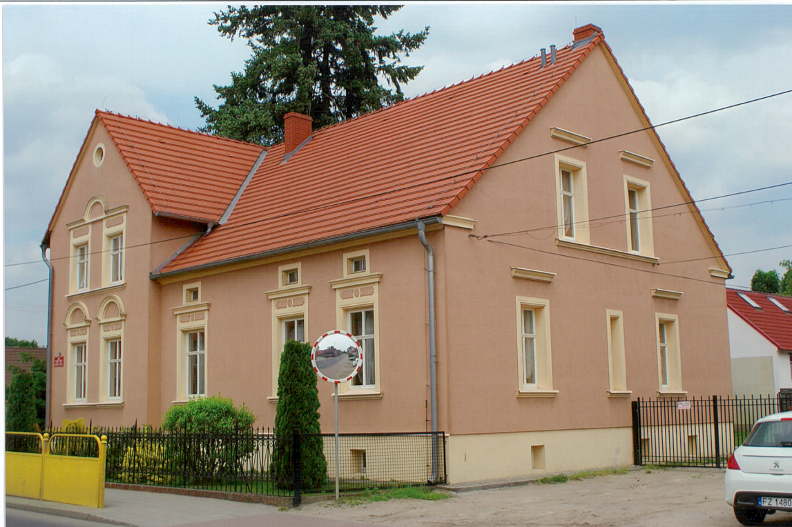
Widok od strony południowo-zachodniej