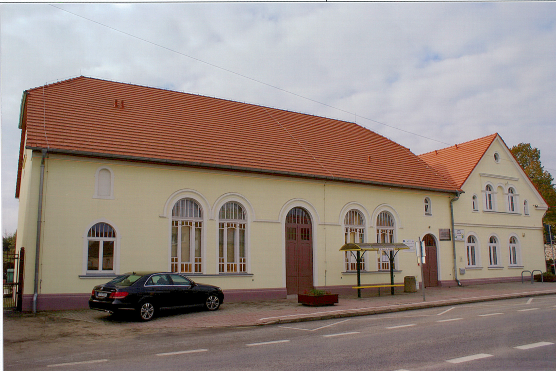
Widok od strony wschodniej