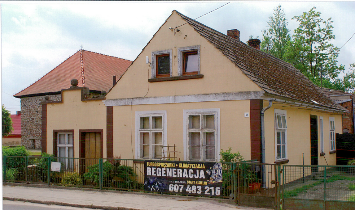
Widok od strony północno – wschodniej