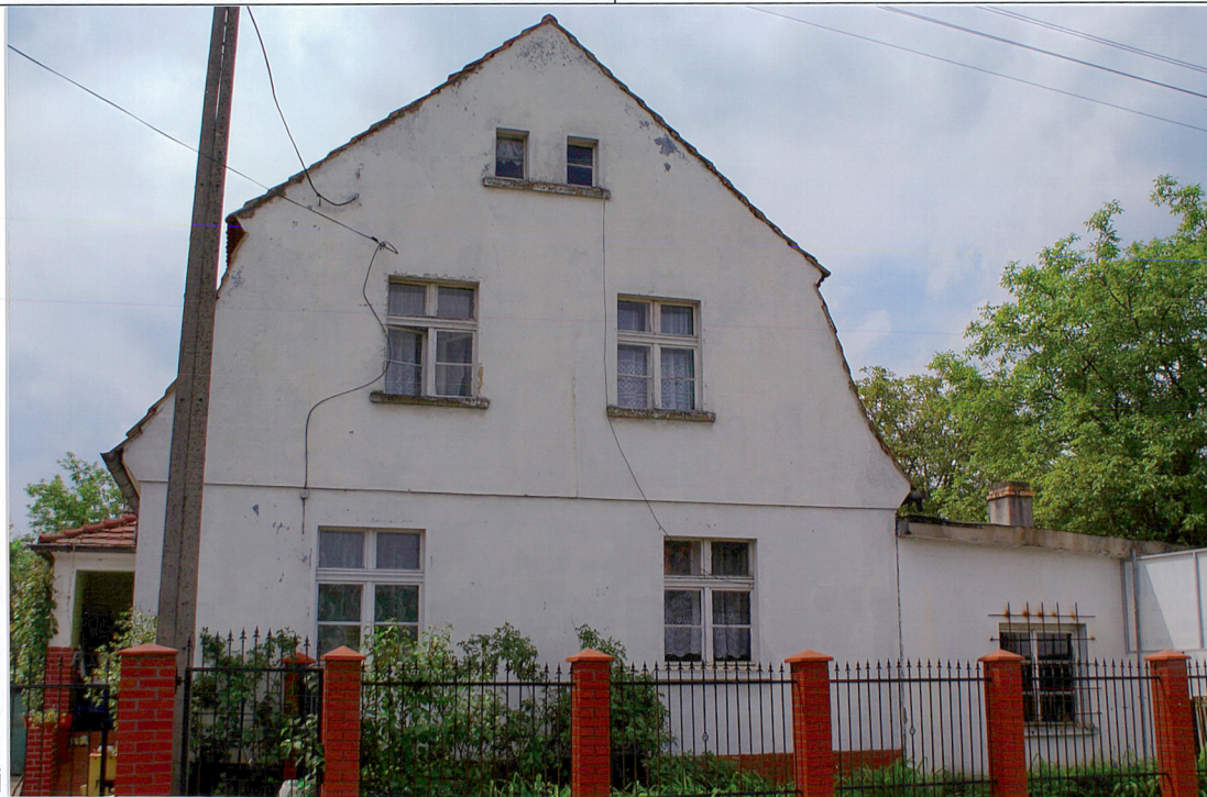
Widok od strony wschodniej