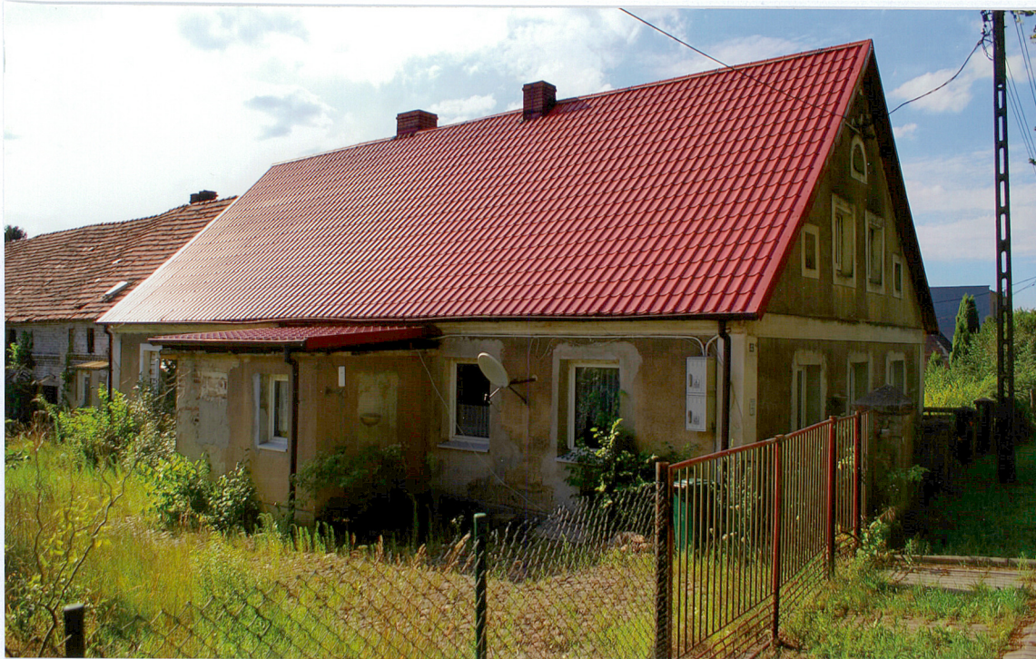
Widok od strony południowej