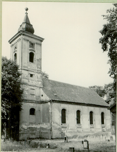
Fot. 1964 (2)