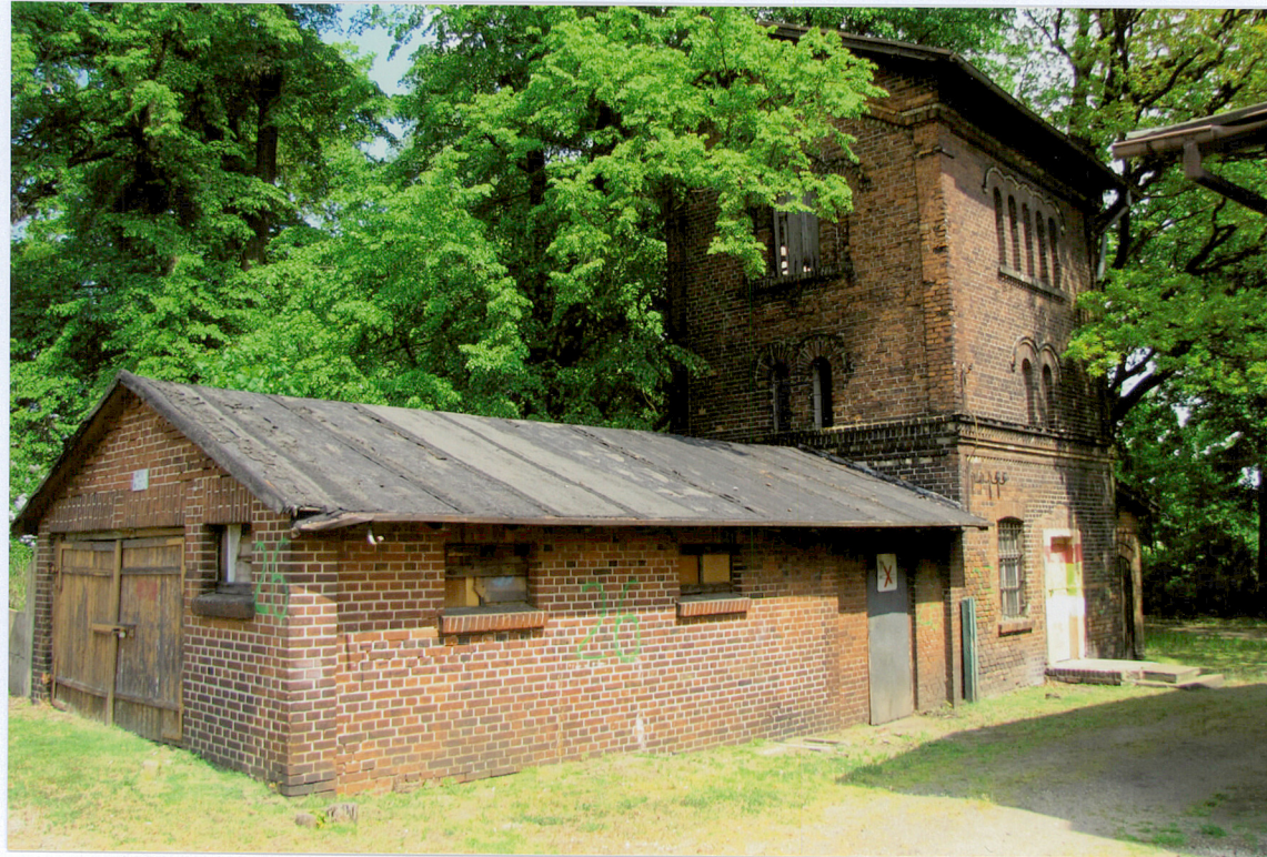
Widok od strony południowo - zachodniej