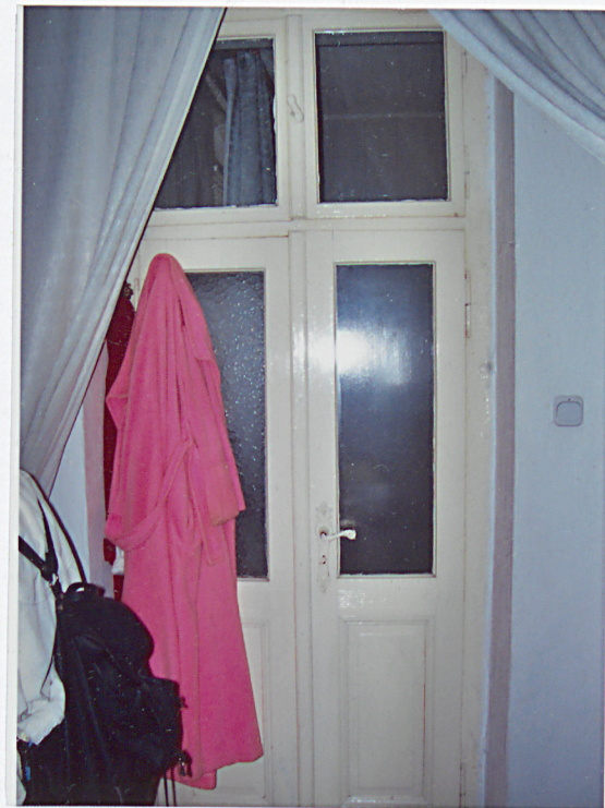
18. Drzwi do łazienki.