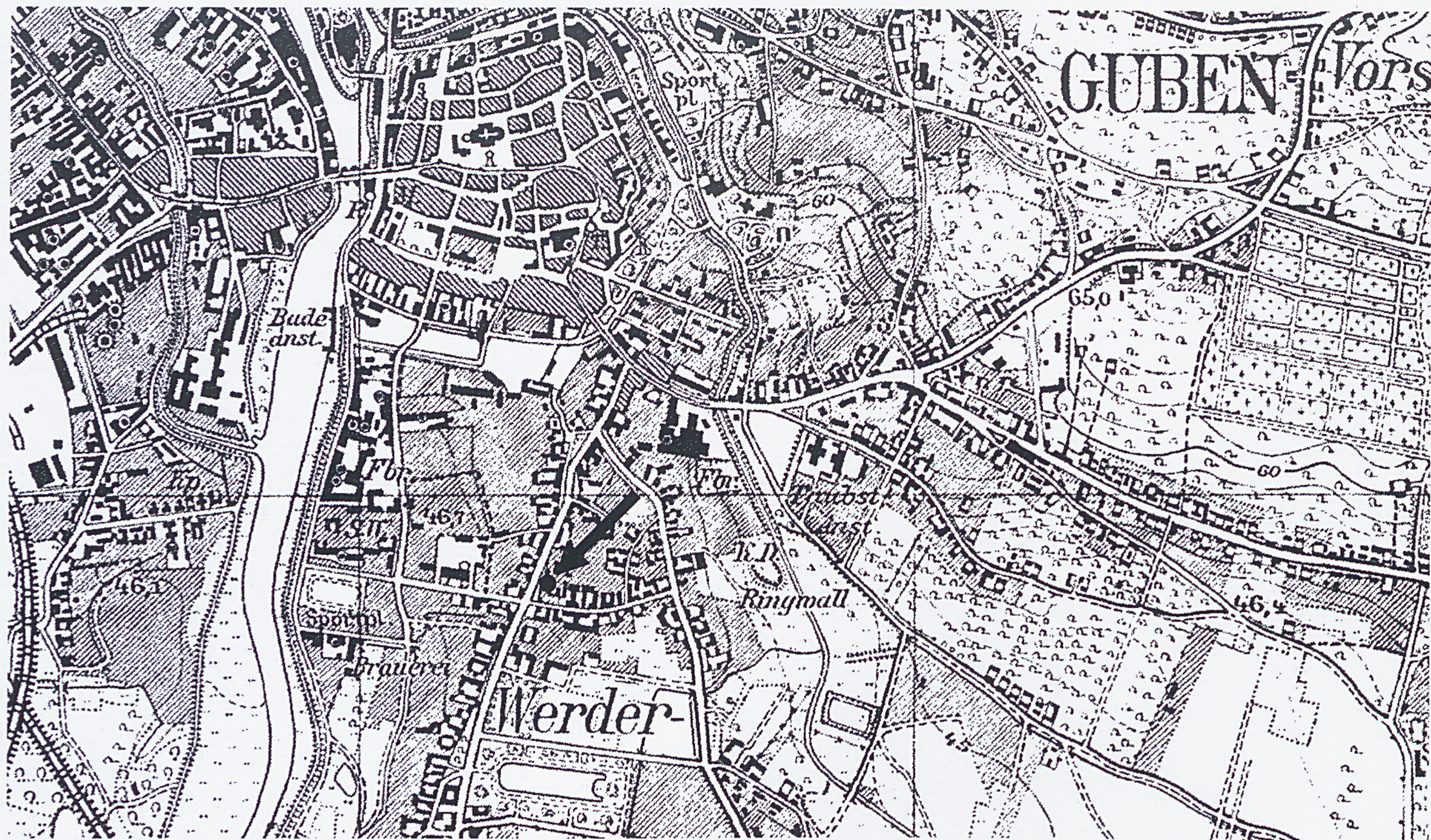
1. Mapa Messtischblatt (nr 4054 Guben) 1933r.