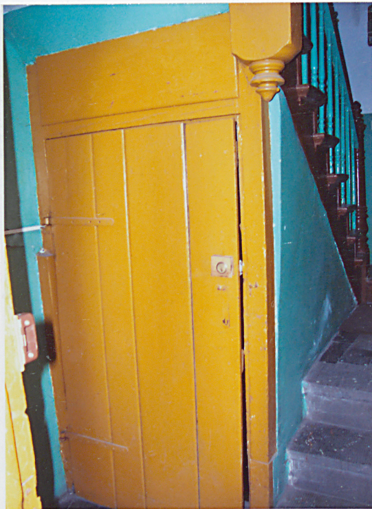
16. Drzwi do piwnicy.