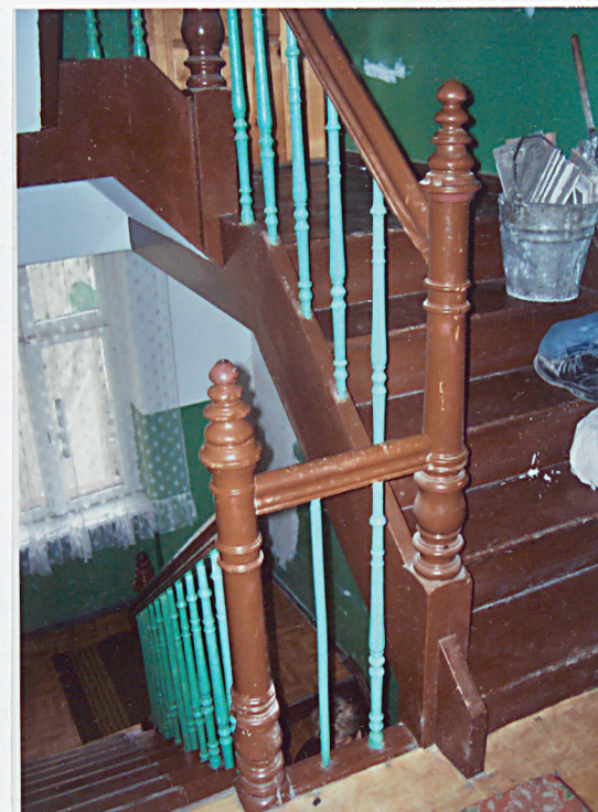
15. Detal balustrady schodów.