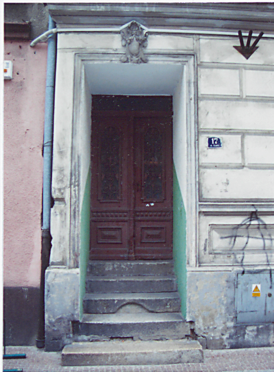
7. Portal wejściowy