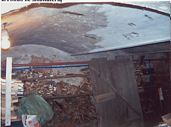
4. Sklepienia piwnicy.