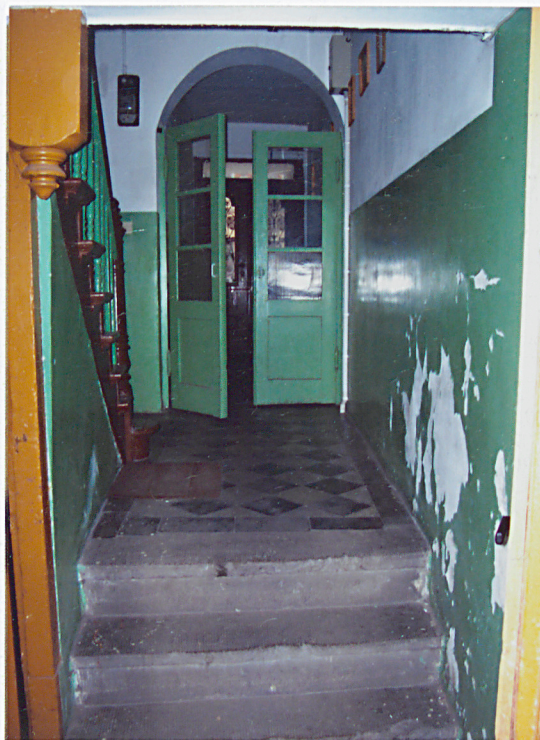
13. Korytarz parteru.