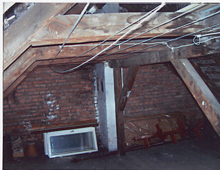
3. Fragment części konstrukcji dachowej.