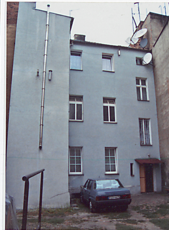
9. Elewacja tylna.