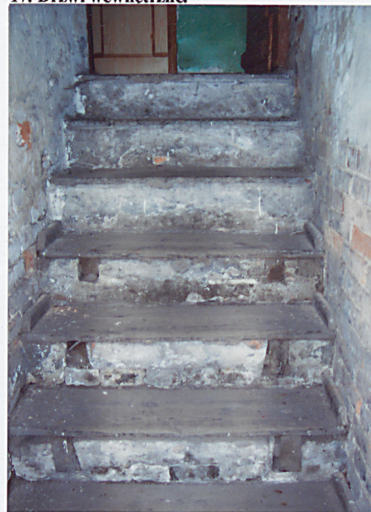
20. Schody do piwnicy.