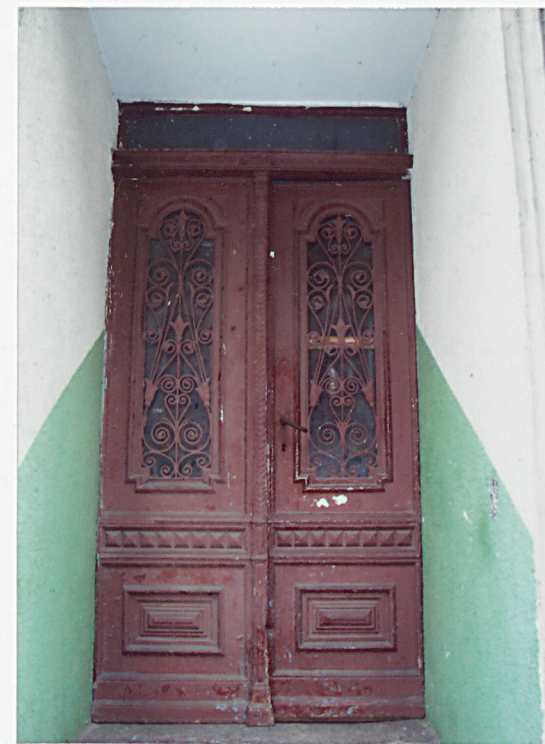
6. Drzwi wejściowe.