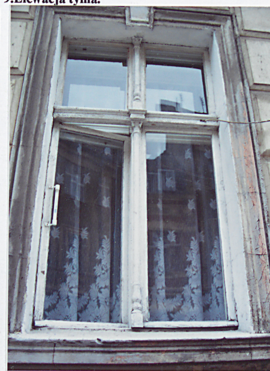
12. Okno z oryginalną stolarką