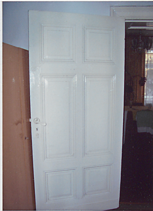
17. Drzwi wewnętrzne.