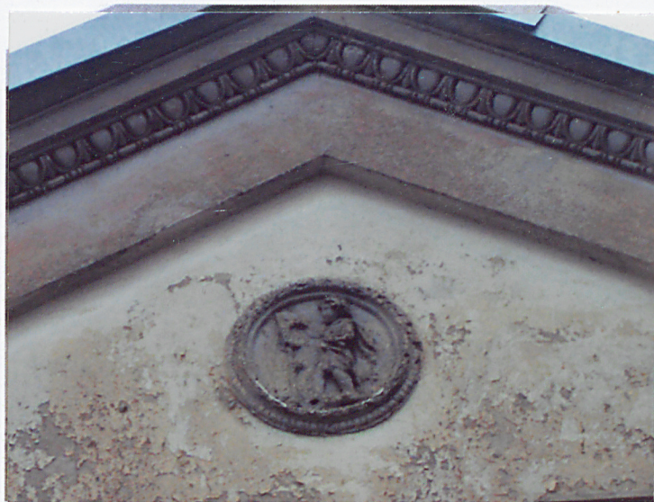
2. Tondo ze sztukaterią