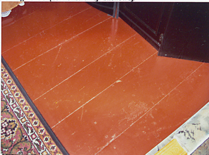
5. Podłoga deskowa.