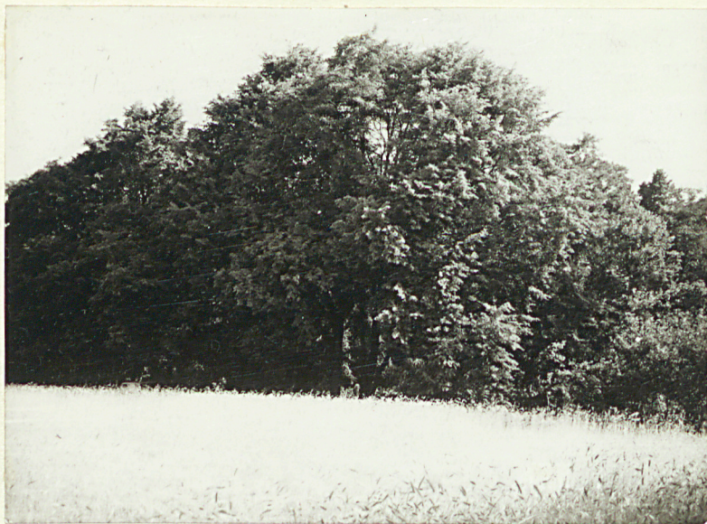
1. Widok ogólny terenu cmentarza w kierunku północnym