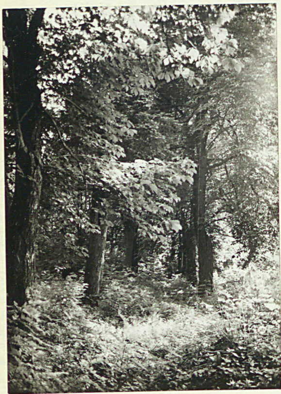
2. Widok ogólny głównej alei cmentarza w kierunku zachodnim