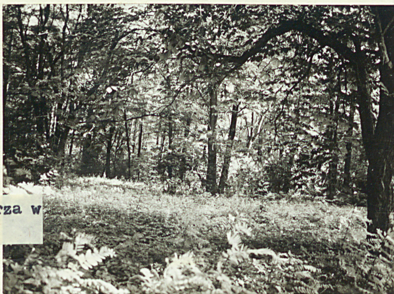
3. Widok ogólny terenu cmentarza z relikto- wo zachowanymi fragmentami nagrobków ewangelickich w części wschodniej