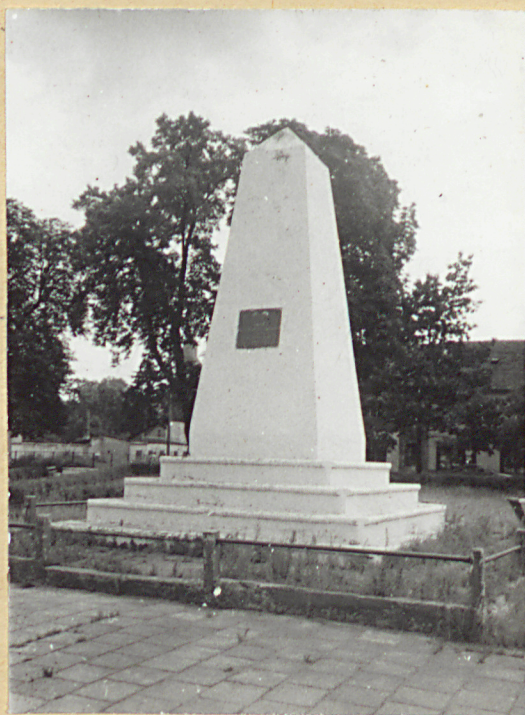
2. Pomnik ku czci żołnierzy radzieckich