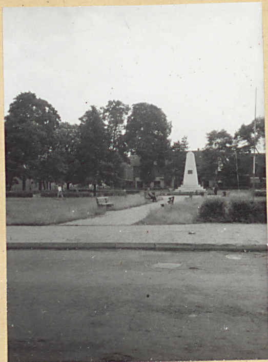
1. Widok d.cmentarza / obecnie skwer /