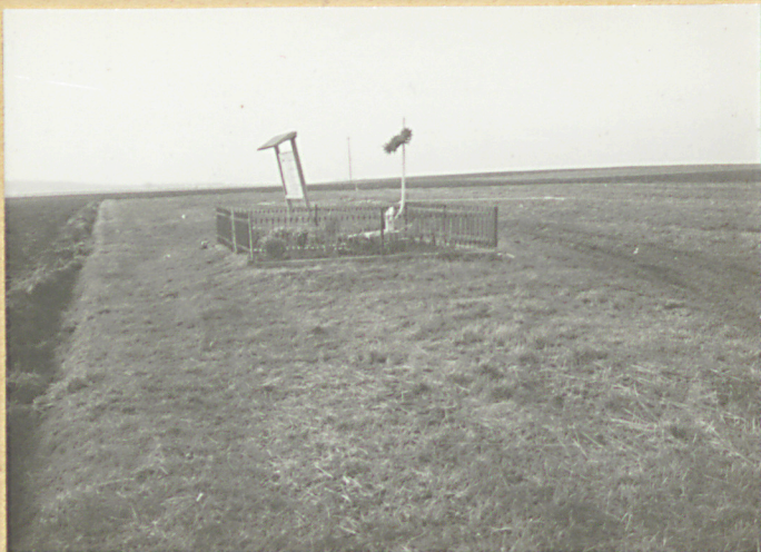
1. Widok cmentarza od południowo-wschodu.