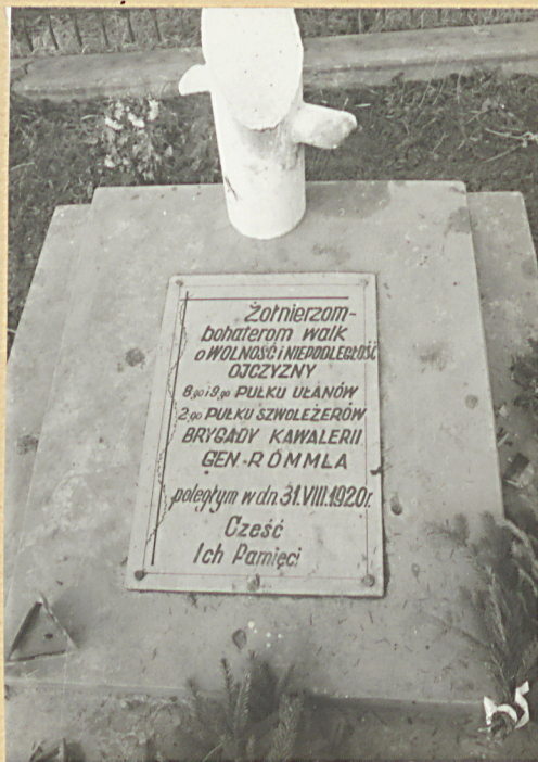
2. Płyta z metalową tablicą na symbolicznej mogile.