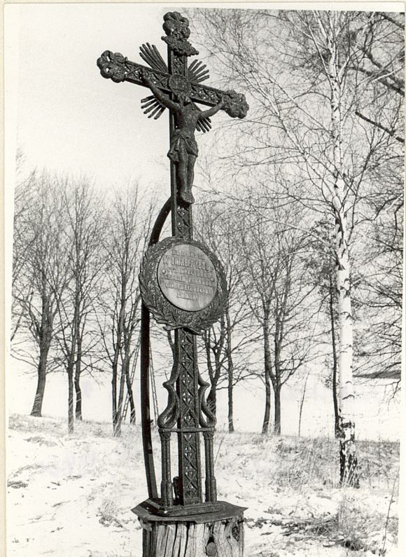
fot.6. Krzyż żeliwny z 1888r. inskrpcja w Języku rosyjskim "Na pamiat 17 oktiabria 1888 ot krestijan dierewni Gajewni- ki skierbieszowskoj gminy".