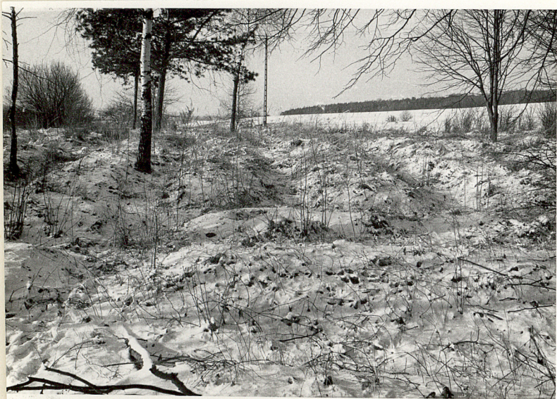
fot.4. Widok wnętrza cmentarza