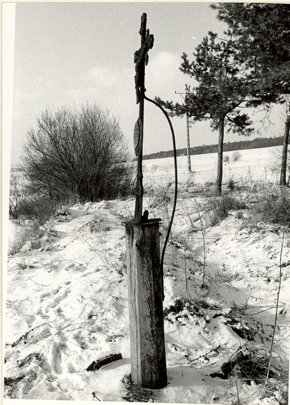
fot.5. Krzyż żeliwny z 1888r.