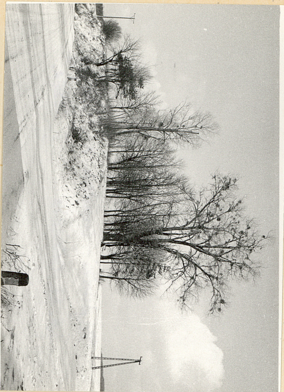
fol.1. Widok cmentarza od strony wschodniej.