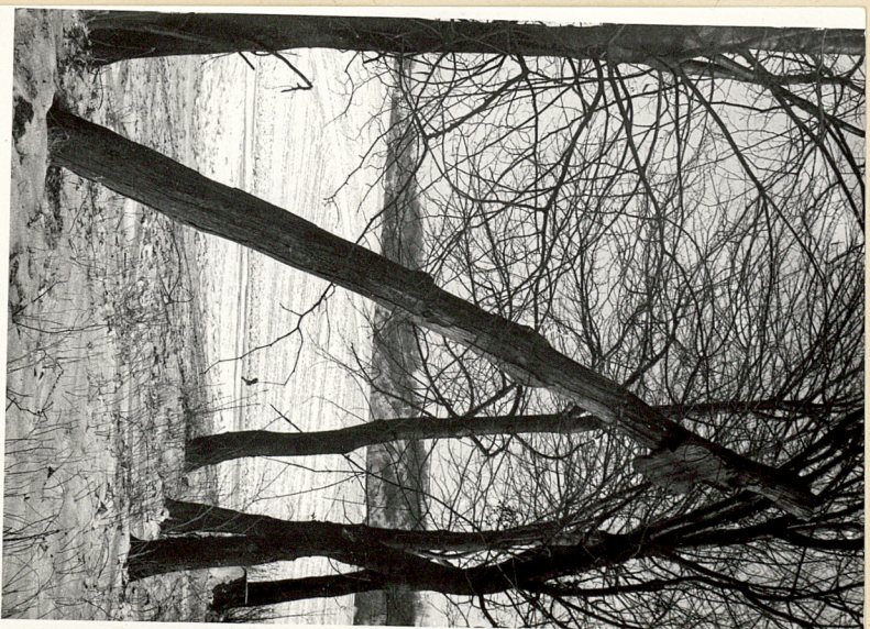
fol.3. Krzyż drewniany w północnej części cmentarza.

Ad.18 Na terenie cmentarza znajduje się krzyż żeliwny umieszczony na drewnianym słupie/prawdopodobnie przeniesiony na cmentarz z innego miejsca na wsi/. Do krzyża przytwierdzona jest tabliczka żeliwna z napisem w jęz.rosyjskim.