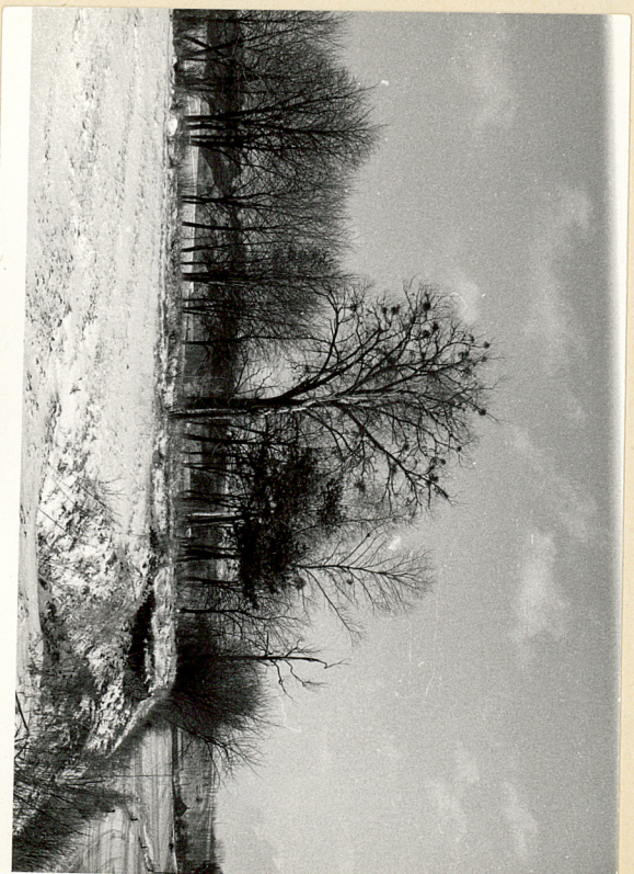
fol.2. Widok cmentarza od strony zachodniej.

Ad.22 W południowej i wschodniej części cmentarza występują : topola biała o r zmiarach pomnikowych oraz samosiewy lipy i topoli białej .