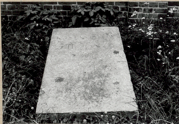
nieczytelne epitafium - nagrobek w zach. części cmentarza