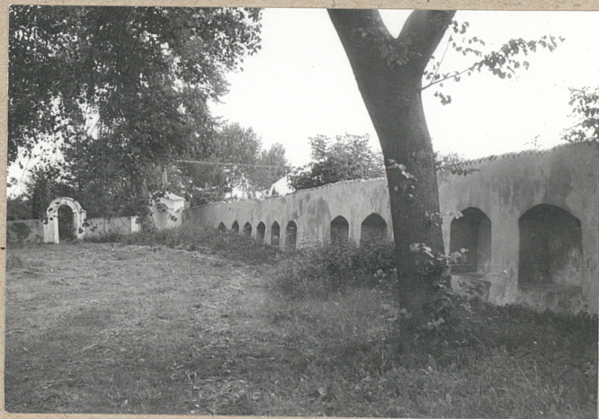
mur cmentarza od strony wsch. - od wewnątrz