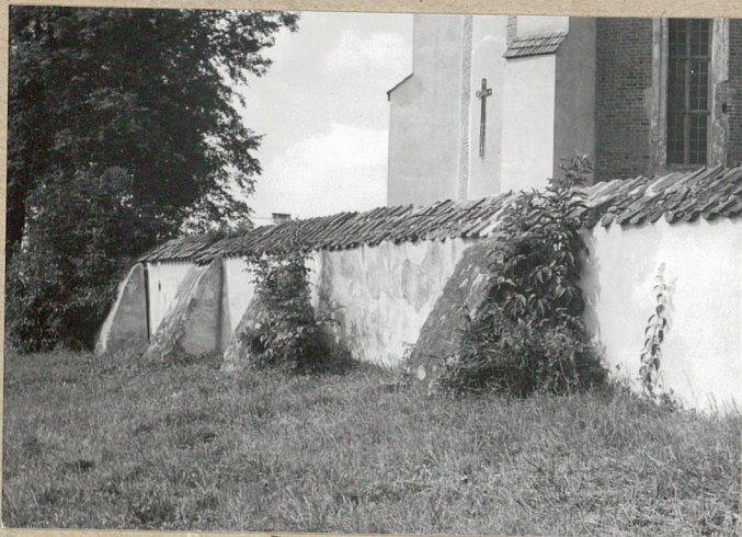
mur cmentarza od strony wsch. - od zewnątrz