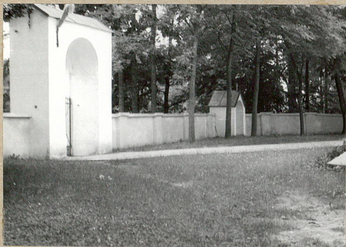
1. Południowa strona cmentarza.