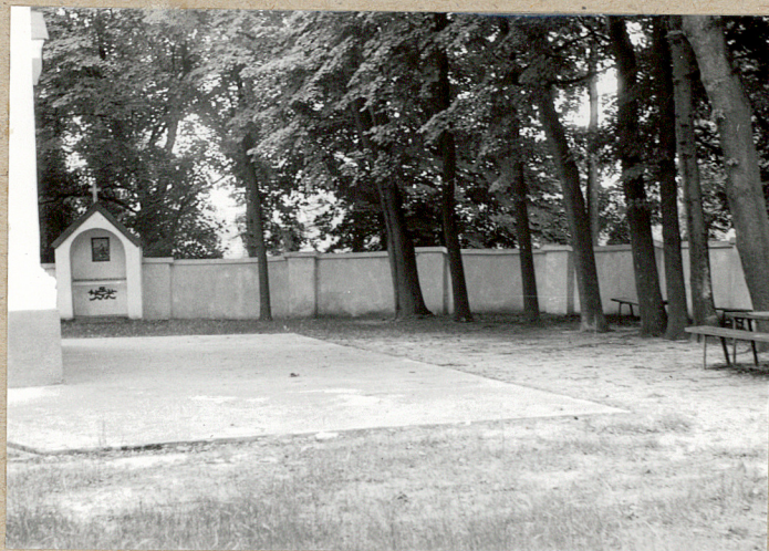
2. Zachodnia strona cmentarza.