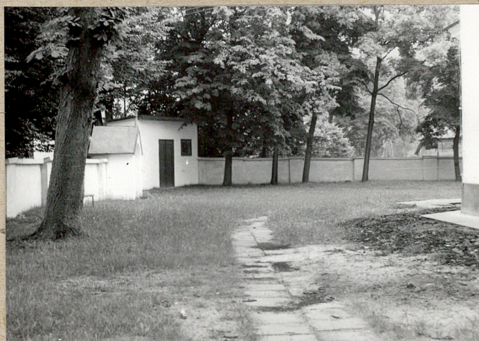
4. Północna strona cmentarza.