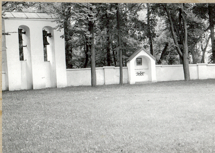
3. Południowo-wschodnia strona cmentarza.