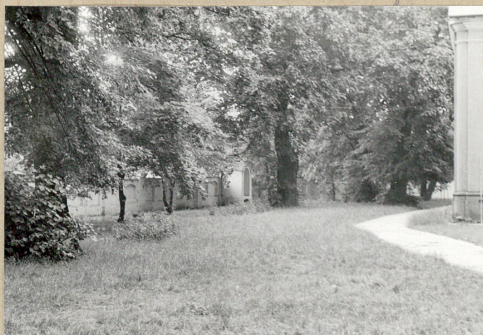
6. Cmentarz od strony północno-wschodniej.