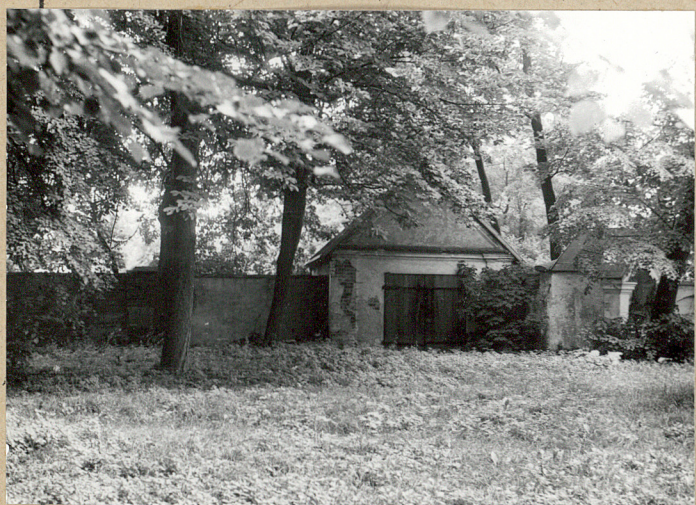
5. Widok na kostnicę przy zatamowaniu starego murowu.