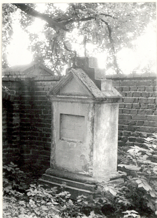
10. Nagrobek z 1851 r.