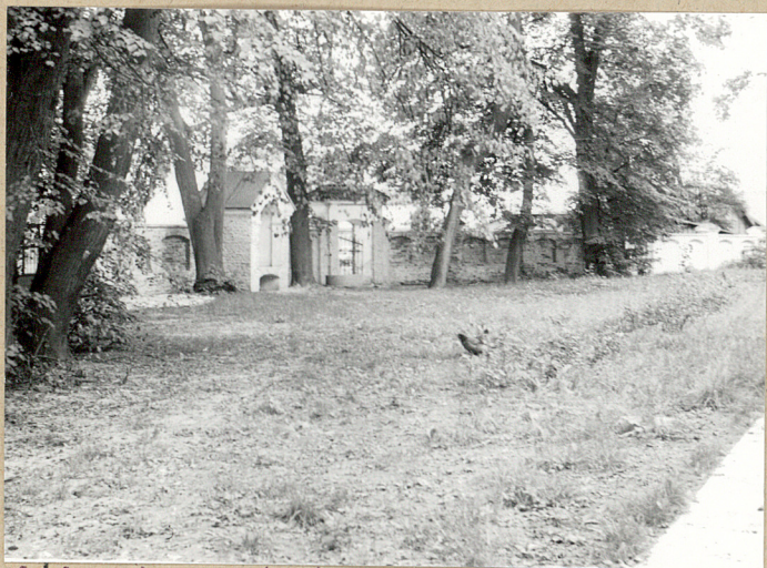
3. Cmentarz od strony południowej