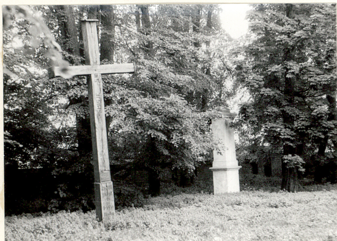
7. Cmentarz od strony wschodniej.