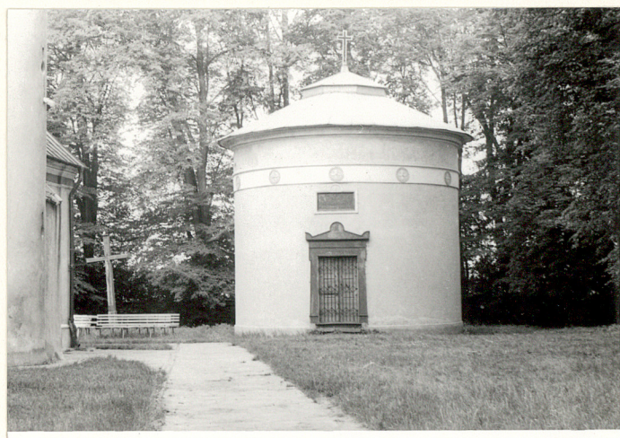
8. Kaplica Weyssenhoffów.