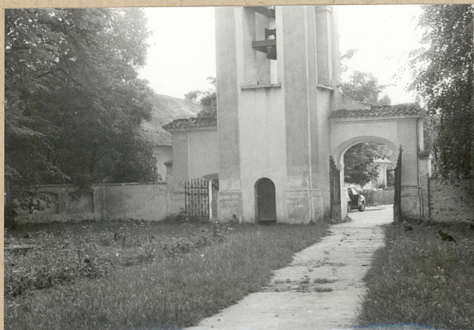
1. Wejście na cmentarz od strony kościoła