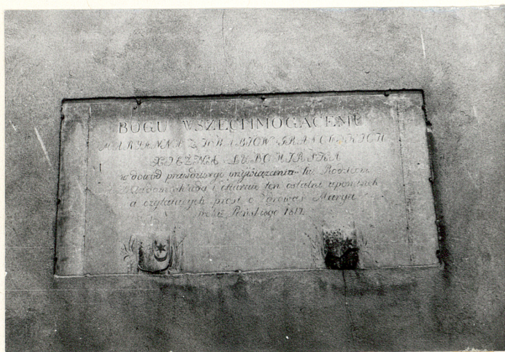
9. Epitafium w ścianie kościoła.