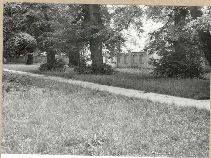
2. Cmentarz od strony południowo-zachodniej