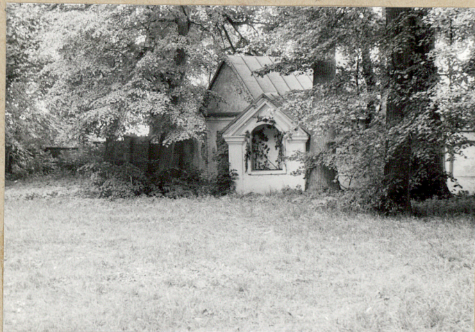
4. Widok na zatamowanie starego murowu i kapliczkę.